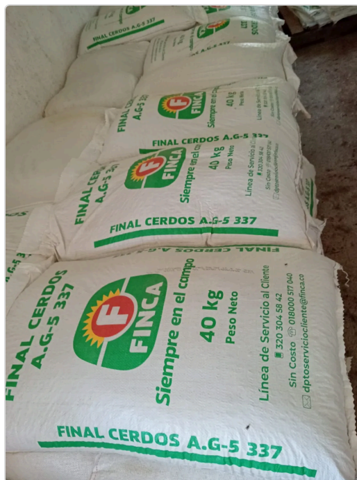
Figura 4. Alimentación