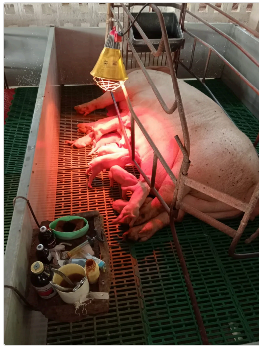
Figura 2. Identificación y manejo sanitario