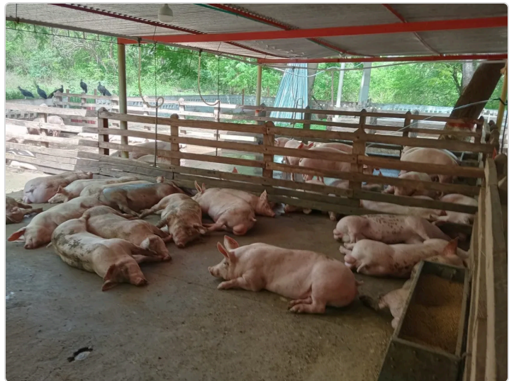
Figura 3. Bienestar animal