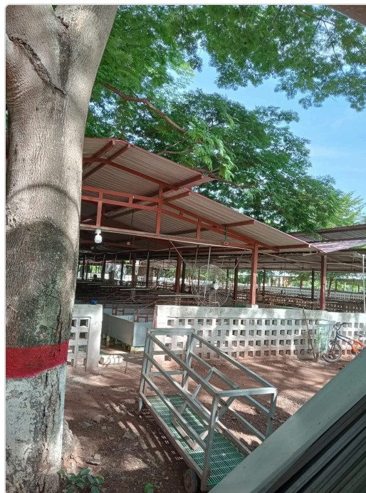
Figura 5. Infraestructura