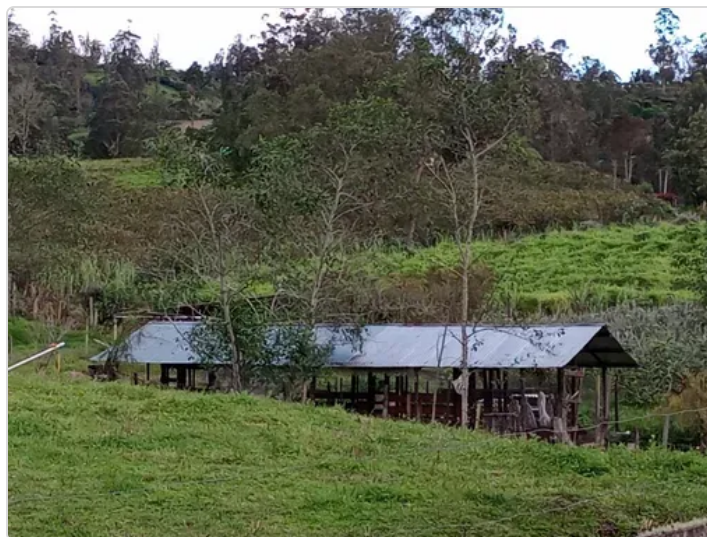
Figura 2. Aprisco

Destinan 3 hectáreas divididas en cuatro corrales para el pastoreo de los caprinos y un corral de monta natural, tienen un aprisco para las distintas etapas productivas, una sala de ordeño y un compostero, hay un protocolo para clasificación y separación de los desechos producidos. Se cuenta con un área de bosque nativo y área de cultivo de las plantas que se utilizan en la elaboración del yogurt como feijoa, morera, arándanos y durazno. Relacionando los ítems de la lista de chequeo sobre instalaciones y áreas de producción primaria, se observa que el predio cumple con la ubicación alejada de zonas de contaminación, los corrales de confinamiento de los animales son adecuados y se han ajustado para disminuir lesiones, presenta diferentes áreas para cuarentena, enfermería y tiene un buen protocolo y recipientes para el manejo de basuras y residuos, sin embargo ninguna de las áreas se encuentra señalizada.