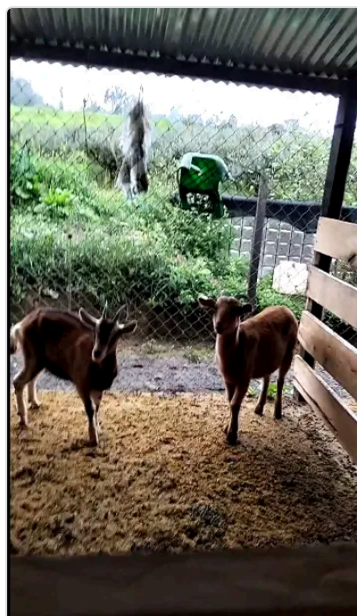
Figura 3. Bienestar animal

Se observa que los caprinos no cuentan con chapas o collares que ayude a identificarlos aunque se manejan una serie de registros con toda la información de ellos, se utilizan protocolos para el recibimiento de los animales nuevos y cuentan con una zona de cuarentena para el manejo de los caprinos enfermos.