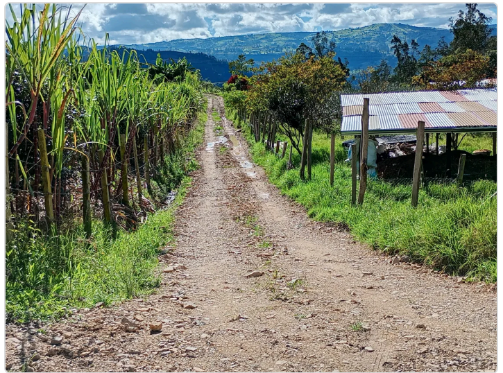
Figura 4. Ingreso al aprisco

Cuenta con el asesoría de un veterinario y sus prescripciones, tiene constancia sobre el correcto uso y almacenamiento de los medicamentos además del periodo de vigencia de estos, no se hace uso de sustancias prohibidas ni de promotores de crecimiento, se manejan registros del uso y características de los medicamentos veterinarios, se respeta el tiempo para el retiro de los medicamentos, se hace uso de medicamentos e instrumentos de aplicación de venta libre para situaciones de lesiones menores y solo se hace uso de medicamentos de control especial en caso de necesitarlo y se notifican los efectos adversos de los tratamientos si estos se presentan. Sobre los ítems de las buenas prácticas de uso de medicamentos veterinarios, se cumple con todos ellos, se mantiene plan de vacunación, seguimiento y asesoría de veterinario y se cuenta con plan de manejo, almacenamiento, registro, administración y control de medicamentos además de referenciar cualquier efecto adverso observado en el proceso.