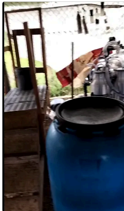
Figura 6. zona de ordeño

Se utiliza como complemento de la dieta el botón de oro, morera ,carretón, kicuyo, tres tipos de pasto reygrass y otras especies nativas. En cuanto a los items de buenas practicas de la alimentación animal, se cumple con todos ellos, se cuenta con lugar de almacenaje, registro ICA, se utilizan suplementos y minerales, la calidad del agua es buena.