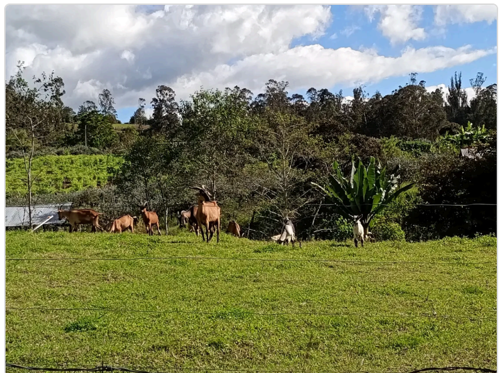
Figura 5. Cabras en zona de pastoreo

En cuanto al personal de trabajo, se le brindan los insumos necesarios para realizar sus labores diarias y se les capacitan en el manejo de los caprinos, los insumos y la manufacturación de los productos lácteos. Cabe desatacar que un caprino está en tratamiento por fractura en las patas delanteras y por ello se implementaron muros de madera en el aprisco para evitar que los caprinos sufran lesiones a futuro, por las mallas que tenían en el corral. Teniendo en cuenta los ítems sobre bienestar animal y personal, se cumplen con todos ellos, es notoria la preocupación y el interés por que los caprinos estén en buenas condiciones de comida, bebida, se observan animales amigables a la cercanía humana, buena cantidad de alimento y espacios naturales para su desplazamiento,