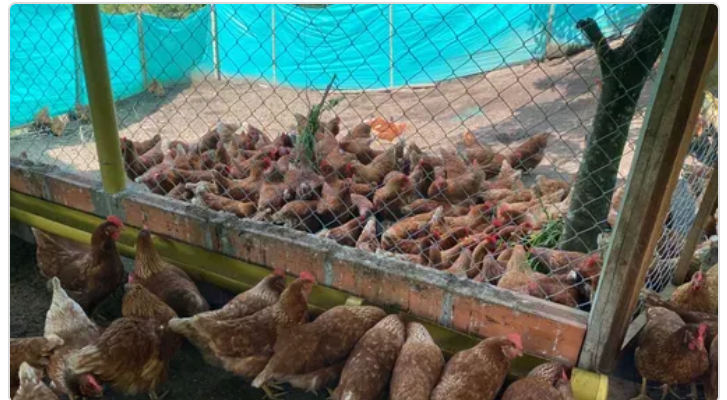
Figura 3. Buenas practicas (BPP) finca la estrada