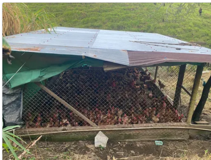
Figura 2. Conversación sobre la producción de huevo.

Contexto Normativo y Regulatorio, la producción avícola de huevo en Colombia está regulada por normas y regulaciones que buscan garantizar la calidad y la inocuidad