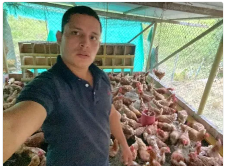
Figura 4. Certificación de la finca la estrada.

La certificación de las BPP en la producción avícola de huevo en la Finca La Estrada es un proceso que busca garantizar que la finca cumpla con los estándares de calidad