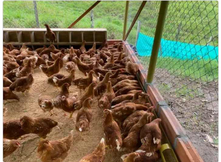
Figura 6. Recomendaciones de la finca estrada.

Considerar la certificación de las BPP para garantizar que la finca cumpla con los estándares de calidad y seguridad establecidos.