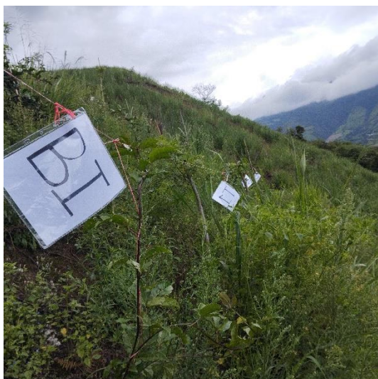
Establecimiento de Proyecto