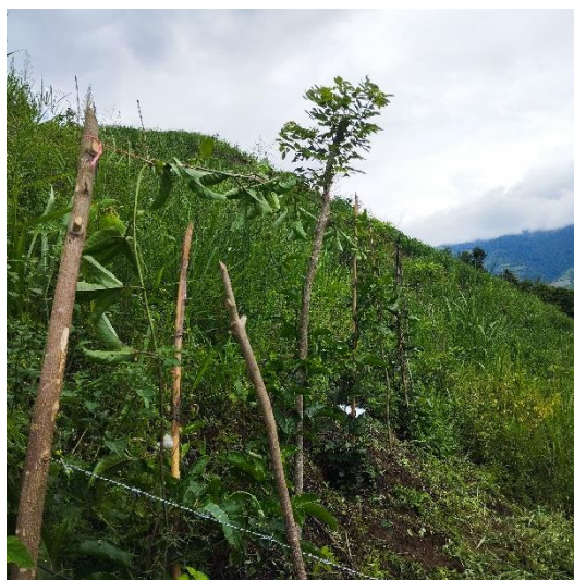
Enraizamiento de Gliricidia sepium