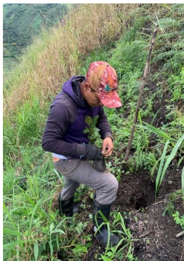
Trasplante Maracuyá ( Passiflora edulis )