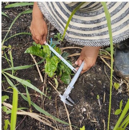
Mediciones de Datos – Área Foliar