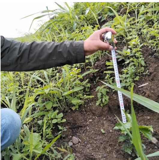
Mediciones de Datos – Altura