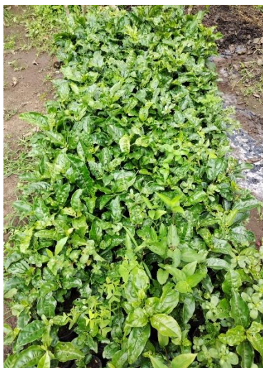
Material Vegetal – Maracuyá ( Passiflora edulis )