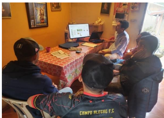
Transferencia de resultados