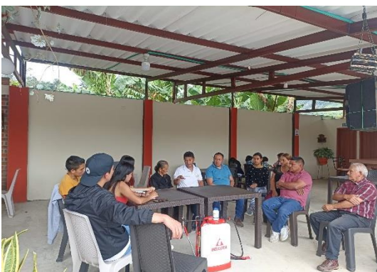
Transferencia de resultados