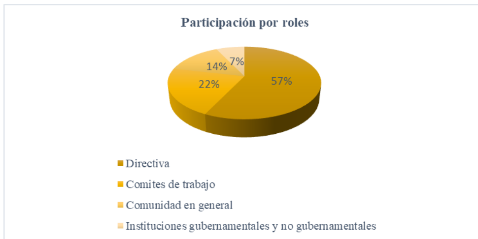
Participación por roles en la JAC Lagunita

Nota: Elaboración propia a partir de la información obtenida en entrevistas y observación directa de las dinámicas de la Junta de Acción Comunal de la Vereda Lagunitas.