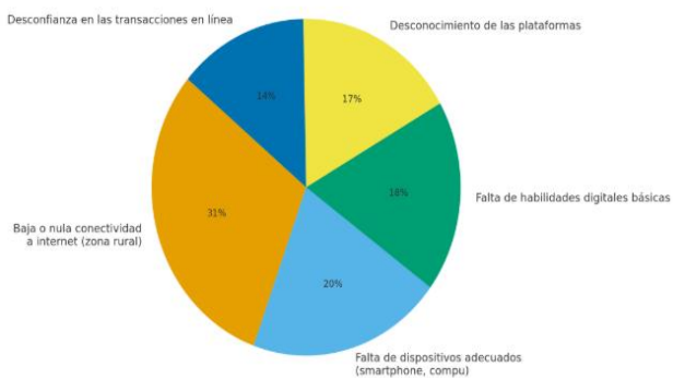
Principales barreras para la Adopción de Estrategias Digitales