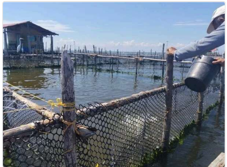
Figura 4. Jaulas de levante

Al haber alcanzado el peso comercial, el productor los moviliza en bolsas y contenedores hasta unas instalaciones exteriores a la producción, donde prepara los peces para adquisición local distribución departamental, esto según el gusto de los comparadores. La producción maneja una producción aproximada de 1,2 a 1,4 toneladas, con un promedio de 12 mil pesos el kilo, siendo estables, dado que