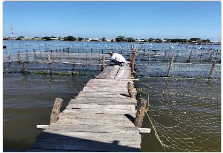
Figura 2. Jaulas de engorde