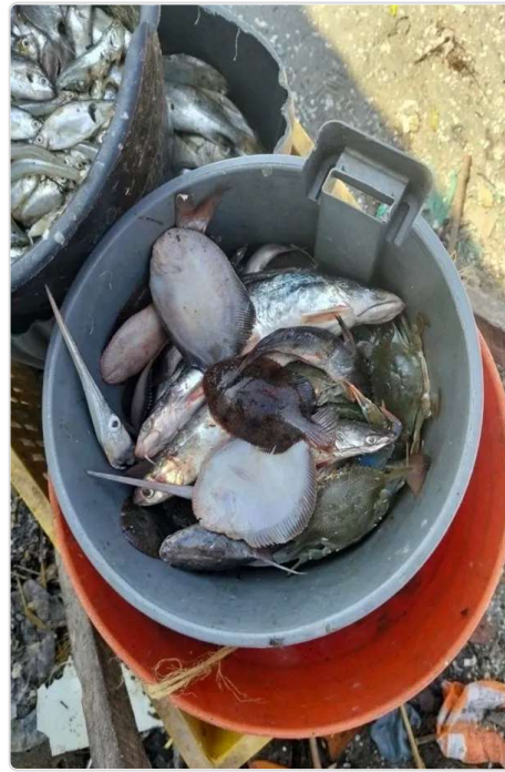
Figura 3. Dieta suministrada