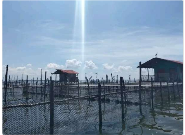
Figura 7. Vista exterior de la producción piscícola de Sábalo El Amado