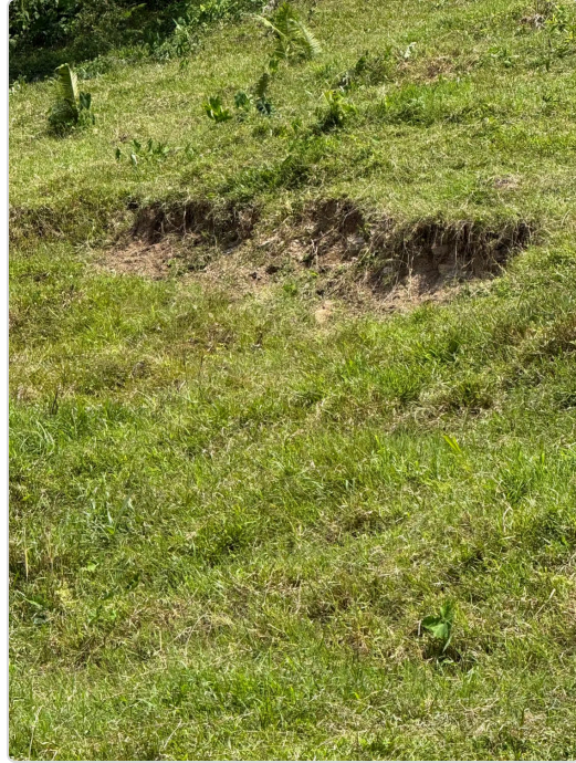
Figura 3. Presencia de erosión en la finca.