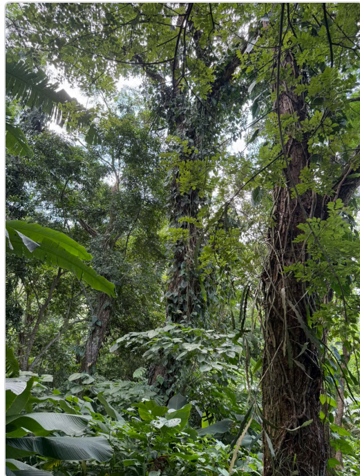
Figura 4. Espacios en la finca donde se podría implementar ganadería regenerativa.