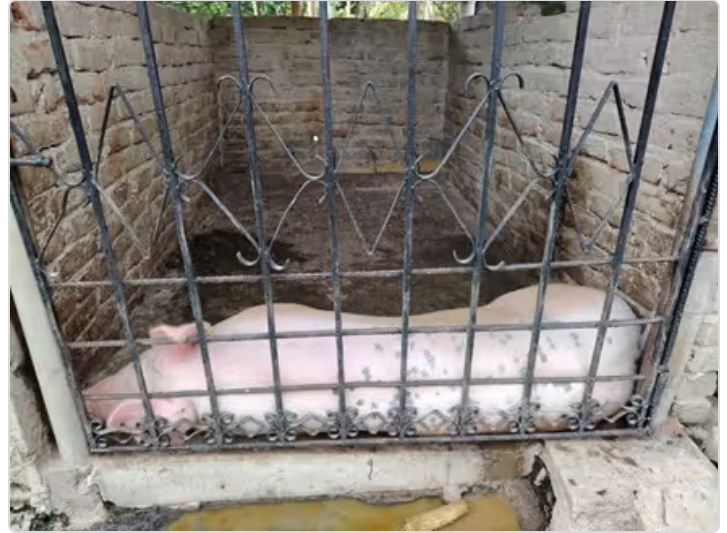
Figura 2. Unidad de porcinos de la Granja Integral La Fortuna.

La visita a la Granja nos muestra que no tienen pediluvios para el personal que vive y trabaja en la granja, no utilizan una indumentaria adecuada para trabajar con los animales, ya que la misma ropa que utilizan en la granja, con esa misma salen a la calle, la unidad de porcinos es un área que a la vista es pequeña para las cerdas que se encuentran allí. La Granja se encuentra en este momento en modificaciones, de instalaciones, se esta reproduciendo especies como: cabras, gallinas, cuyes y conejos y los propietarios de la granja esta en constante aprendizaje, por medio de cursos presenciales y virtuales.