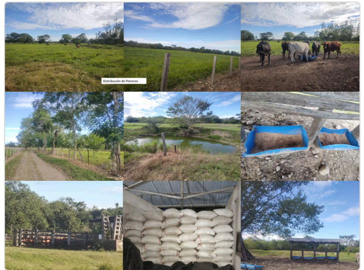
Figura 2. Fotografías documentales del predio El Placer que evidencian varios de los aspectos evaluados en la lista de chequeo de Buenas Prácticas Ganaderas (ICA, Resolución 2020).

Saneamiento y Manejo Ambiental: Incluye la disposición adecuada de residuos y la conservación de los recursos naturales.