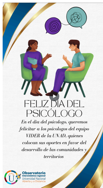
Figura 4. Banner

Nota. Banner día del psicólogo. Elaboración propia