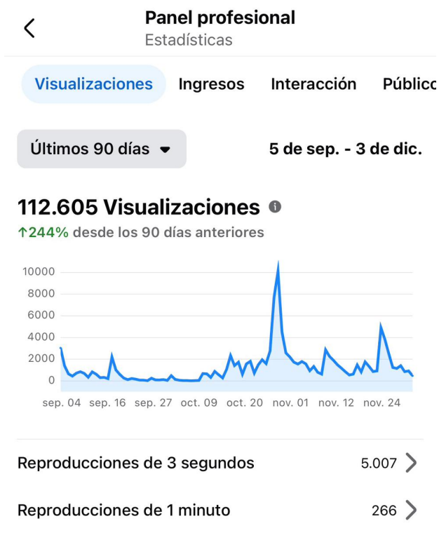
Figura 3. Estadísticas

Nota. Estadísticas de los últimos meses de Facebook. Elaboración propia