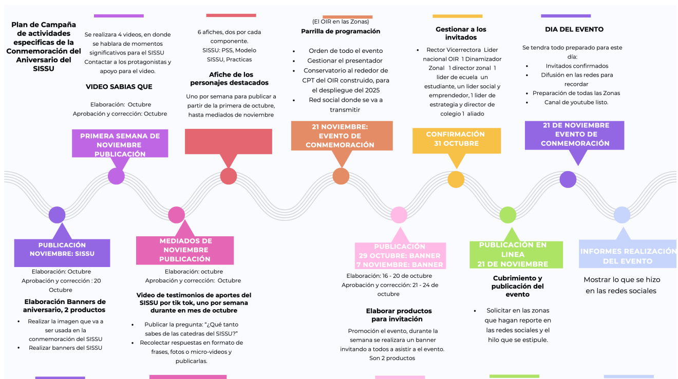
Figura 1 Esquema diseñado

Nota. Muestra del esquema diseñado como plan de trabajo para la campaña de actividades específicas del aniversario del OIR y SISSU. Elaboración propia