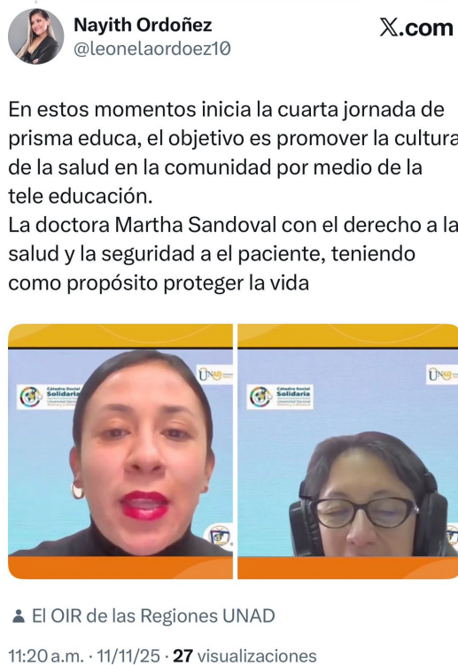
Figura 7. Pantallazo

Nota. Ejemplo de cubrimiento durante el evento. Elaboración Propia