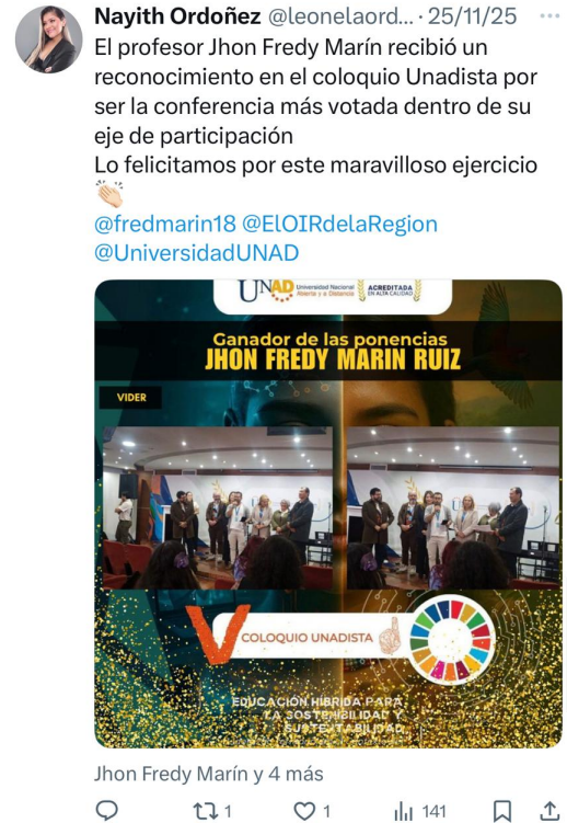
Figura 8. Red social

Nota. Ejemplo después de un cubrimiento, cuando era necesario. Elaboración Propia