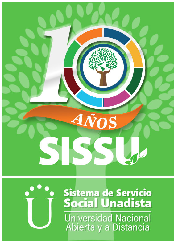
Figura 2. Logo

Nota Logo oficial del aniversario del SISSU. Vergara, E (2025). Elaboración propia