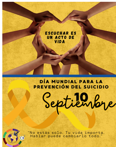
Nota. Banner día del suicidio. Elaboración propia

Se realizaron varios videos de eventos específicos, como el encuentro Anual del CAMBU, fue un video de casi 3 minutos, en donde tiene una combinación de varias, imágenes, videos, testimonios y voz Off, como resultado fue un video para Tik Tok, con 356 vistas y 30 likes, obteniendo un impacto positivo.