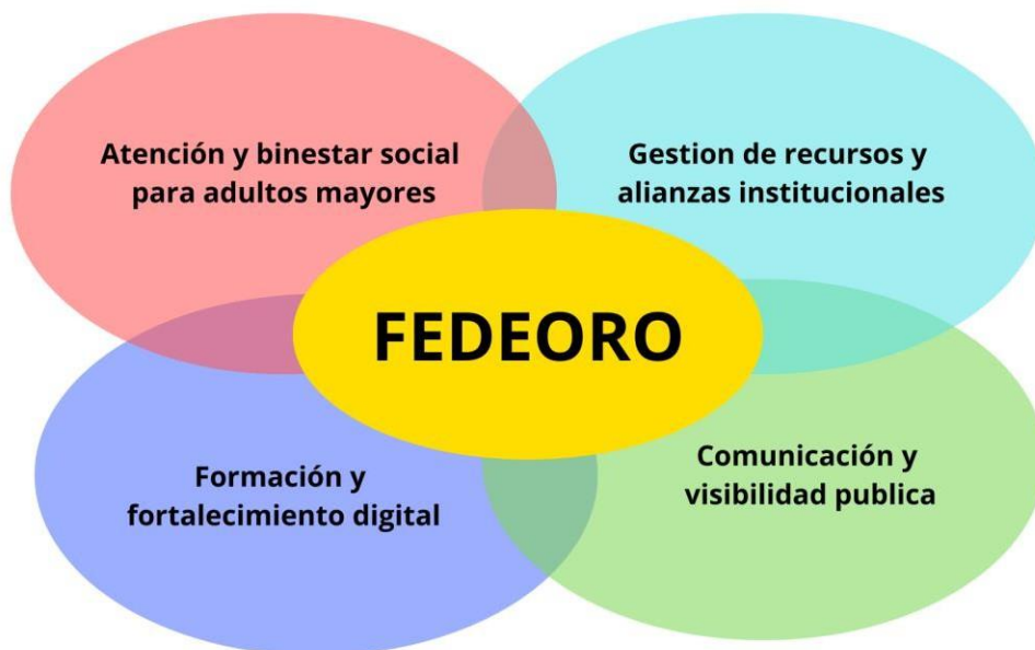
Gráfico de conjuntos de acción

Nota. Elaboración propia (2025), gráfico que representa los conjuntos de acción y la interacción entre los actores de la OSP