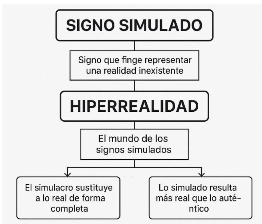
Figura 3 El signo simulado

la diferencia entre una serie de datos neutrales, y una serie de sistemas trazados por sesgos que surgen a partir de la eliminación del signo como referente, y el surgimiento de este como una constante simulación sin referencia. Esto se entenderá de igual manera con la figura 3.