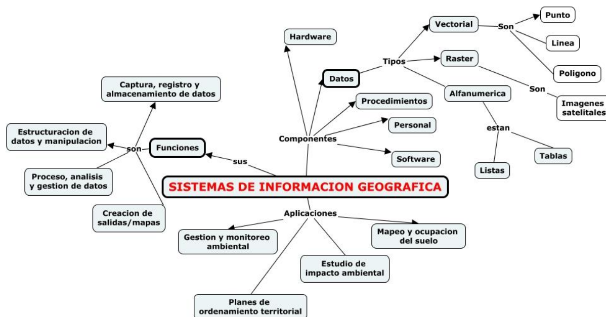
Mapa Conceptual de Sistemas de Información Geográfica

Nota. Tomada de IHMC (I.) CmapTools (n.d.) Mapa conceptual SIG