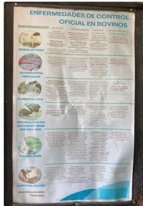
Figura 2. Enfermedades de control oficial

Identificación: La identificación de los animales se realiza de la siguiente manera: al nacer, los animales son