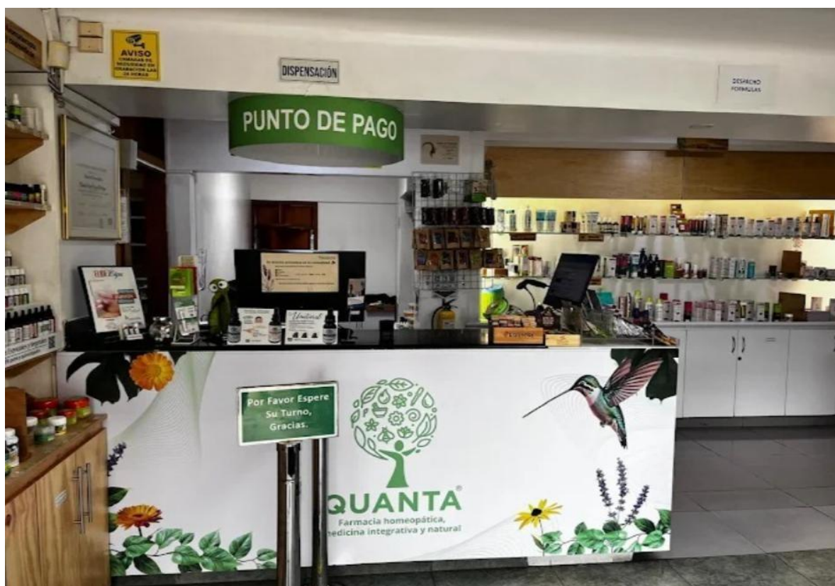
Figura 4 Registro fotográfico del proceso contable en SIIGO

Nota. Pasantía Farmacia Quanta S.A.S (2024) Farmacia Quanta. Documentos aquí mostrados cuentan con la aprobación de la entidad.