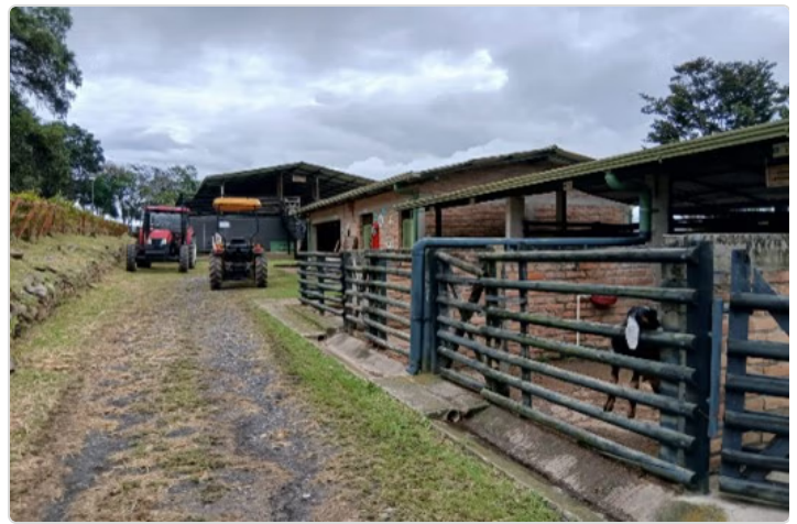
Figura 2. Instalaciones granja Los Andes.

Las instalaciones de la granja Los Andes del SENA, cuenta con 3.9 hectáreas, de las cuales se encuentran áreas delimitadas, para la producción caprina; 1. Área de producción: se cuenta con un sistema de producción estabulado, el cual cuenta con 8 módulos de producción, para cría y levante, con 06 módulos para reproductores; cuneta con el área de bodega de insumos y medicamentos veterinarios. 2. Área de enfermería y cuarentena: Esta área se encuentran a unos 200 metros del sistema de producción, lo cual dificulta el traslado de un animal enfermo al área de enfermería, por lo que es indispensable el traslado del área de enfermería a un sitio cerca al sistema de producción caprino con el fin de intervenir al animal enfermo de forma oportuna. 3. Laboratorio biotecnología reproductiva y de Sanidad Animal: donde se realizan análisis de hematología, reproducción, parasitología y calidad de leche, también permite evaluar la calidad del semen en caprinos: valoración seminal, examen andrológico o evaluación de la aptitud reproductiva.