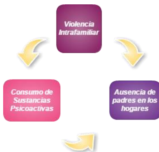
Figura 3. Problemáticas

Básicamente lo que se presenta es un círculo vicioso para los individuos, familias y comunidades afectadas con las problemáticas presentadas, ya que una de ellas puede generar la siguiente, o existir presencia de más de una problemática.