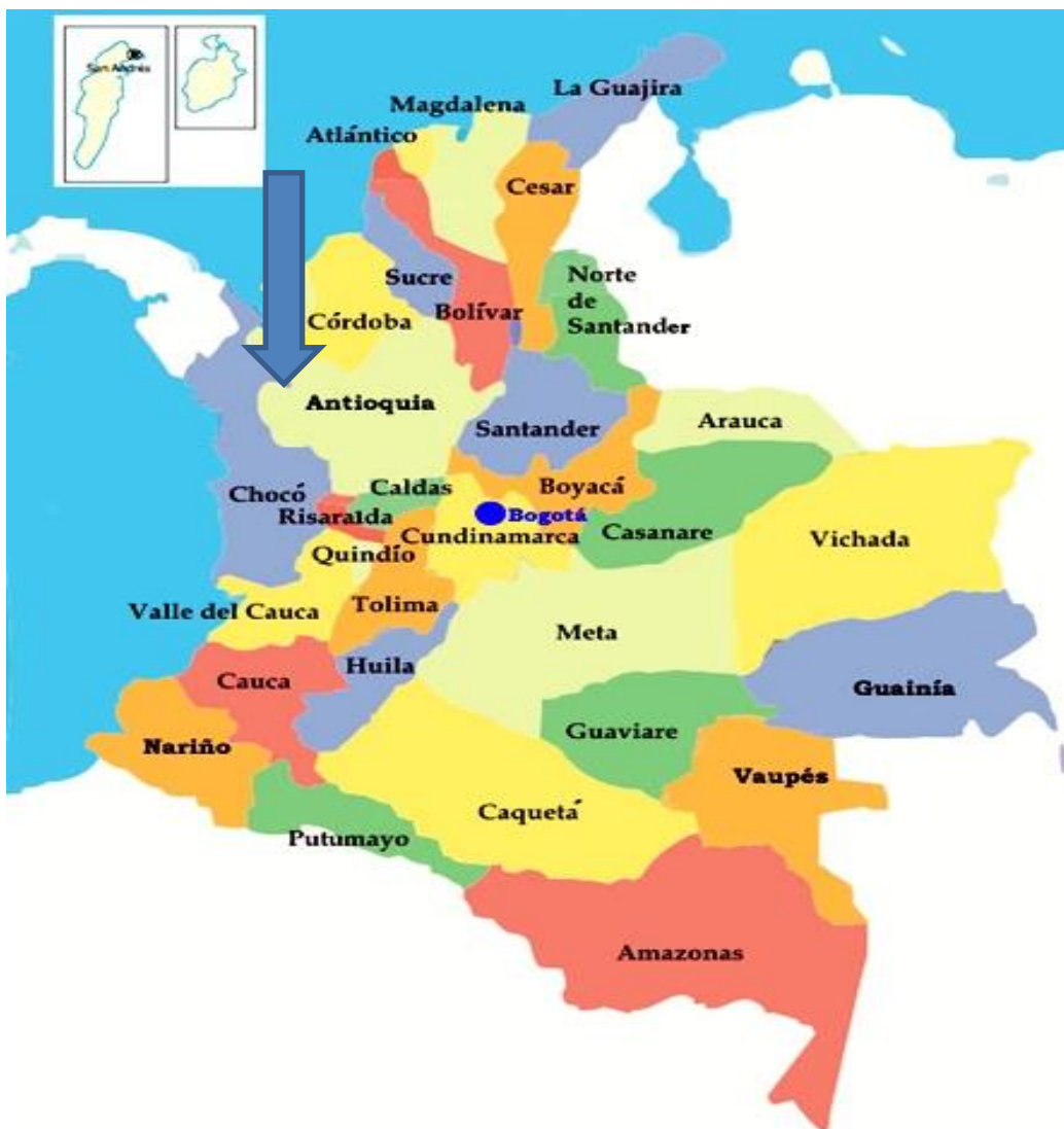
Figura 1. Mapa Situacional Colombia

Municipios Participantes: Cáceres, Ciudad Bolívar, Medellín y Rionegro