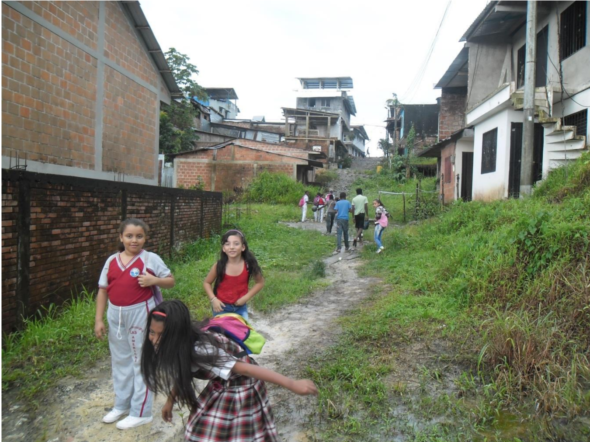
Figura 3 Sitio de acceso a la Institución Educativa las Américas, sede la Dignidad de Buenaventura

Las niñas y los niños de Quinto grado de la Institución Educativa Las América, sede la Dignidad, residen todos en zonas muy cercanas a su colegio. Son hijos de padres que en muchos casos no han terminado el bachillerato y en otras a dudas penas tienen aprobado quinto de Primaria. Estos padres de familia pese a las difíciles situaciones económicas, se esfuerzan para que sus pequeños estudien. Ellos tienen muy buenos deseos para con sus hijos: “Que no se queden como ellos que no pudieron estudiar porque sus padres carecerían de recursos” manifestó un padre de familia al interrogarlo sobre la dura situación en este lugar.