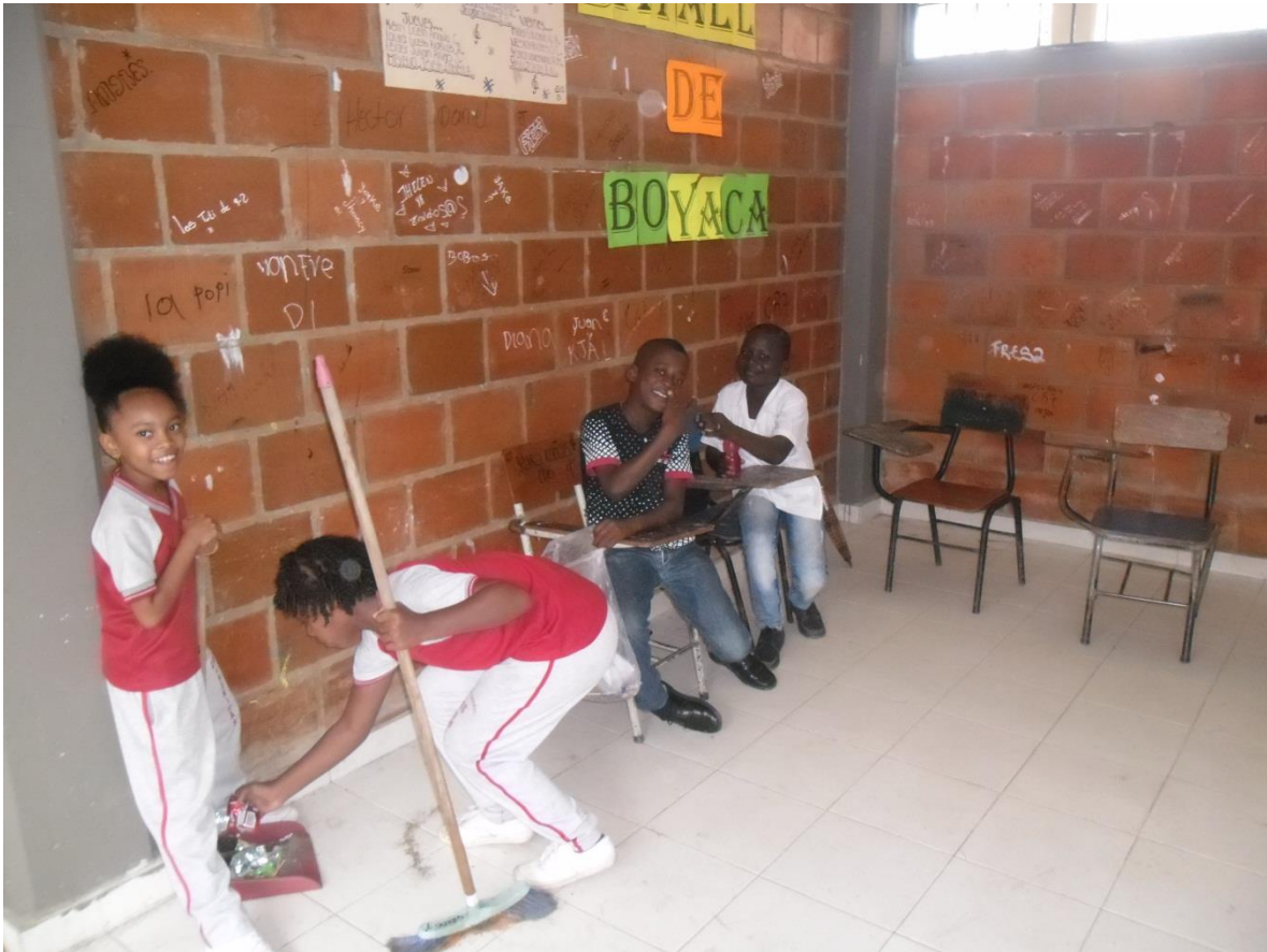
Figura 6. Niñas limpiando el salón de clases.

Estos niños y niñas saben que también en ellos recae la responsabilidad que tenemos todos del cuidado con el plante y hacen todo lo que pueden para mantener limpia su institución. Así las instalaciones del colegio estén muy descuidadas esto aviva más el deseo de mantener limpio su colegio.