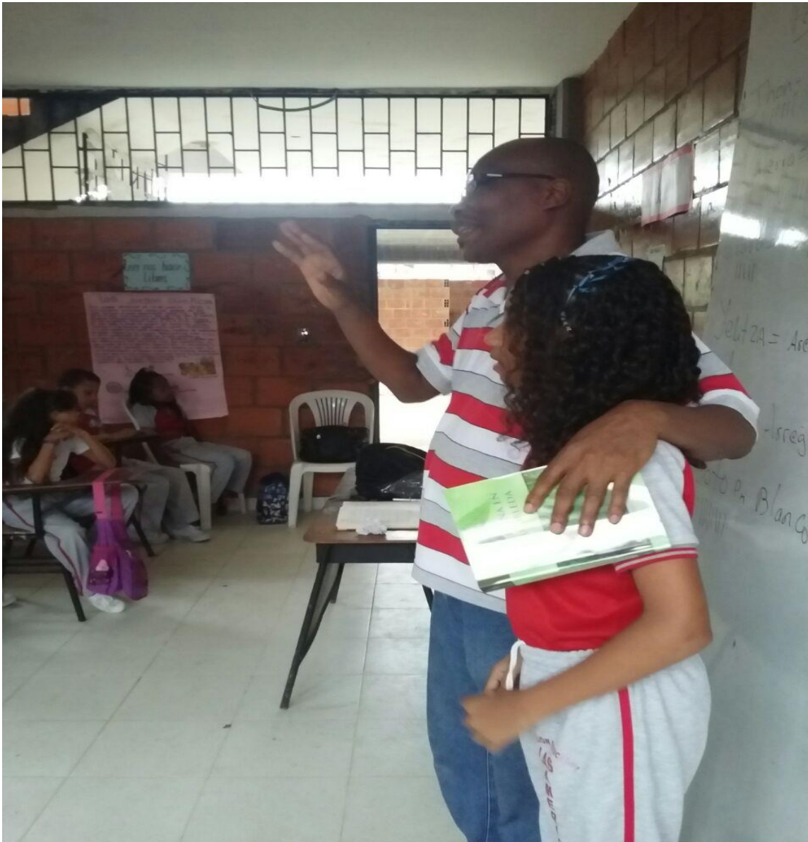
Figura 16. Compartiendo conceptos con los niños y niñas del Quinto grado de la Institución educativa las Américas en su sede la Dignidad.

Pero ¿qué es lo que ha movido a las maestras de Quinto Grado de la Institución Educativa las Américas enseñar Cultura Política y además Comportamiento Ciudadano a unos niños con una edad promedio de 16 años?