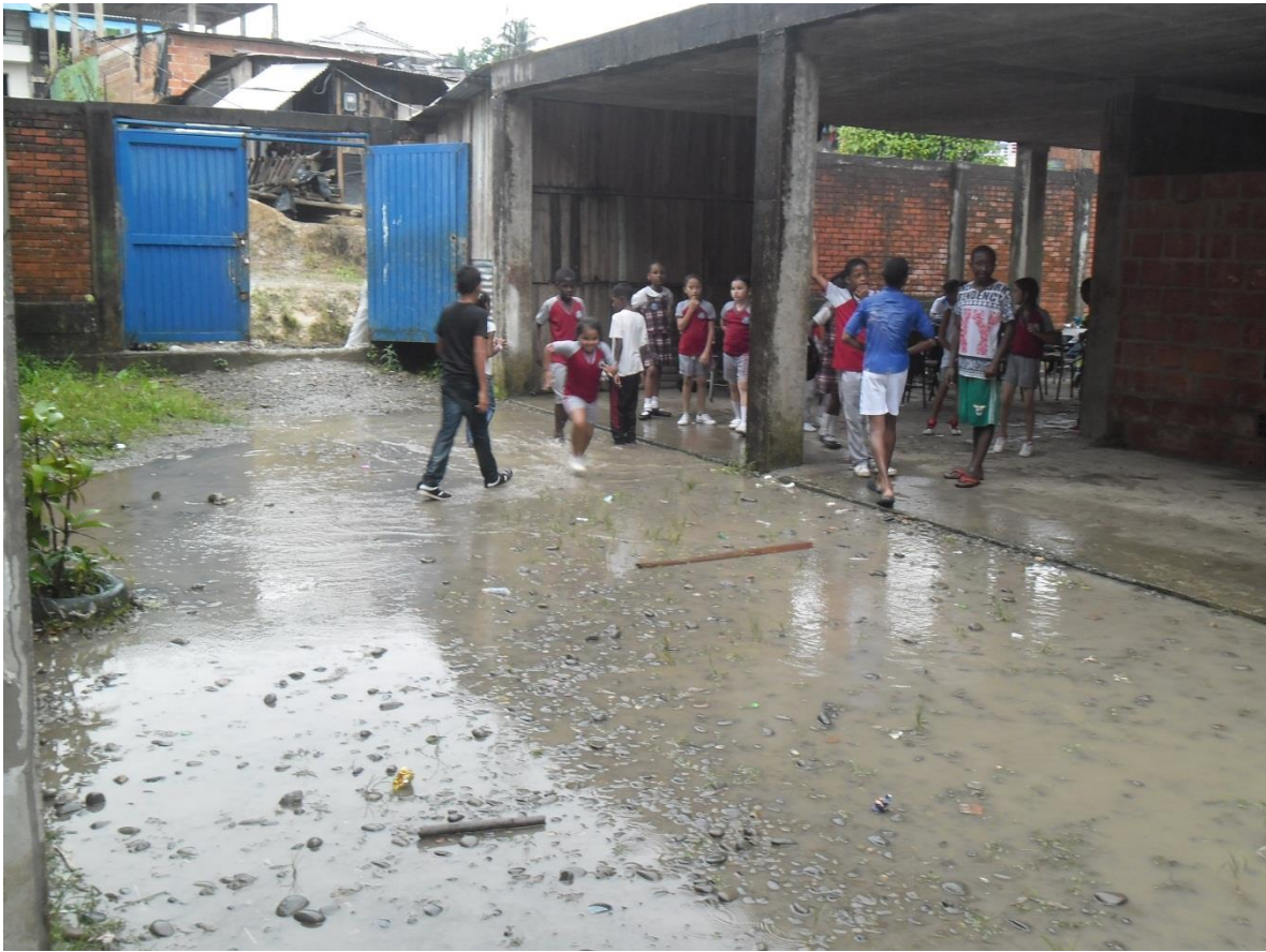
Figura 15. Patio de la escuela donde juegan los niños después de una fuerte lluvia.

Para los estudiantes de quinto grado de la Institución Educativa las Américas, de Buenaventura la democracia: “Es una forma de gobierno escogida por muchos países del mundo incluyendo Colombia” para algunos, para otros: “es una forma de gobierno creada por los griegos y que ahora han adoptados muchos países como el nuestro”. Son conceptos muy acertados.