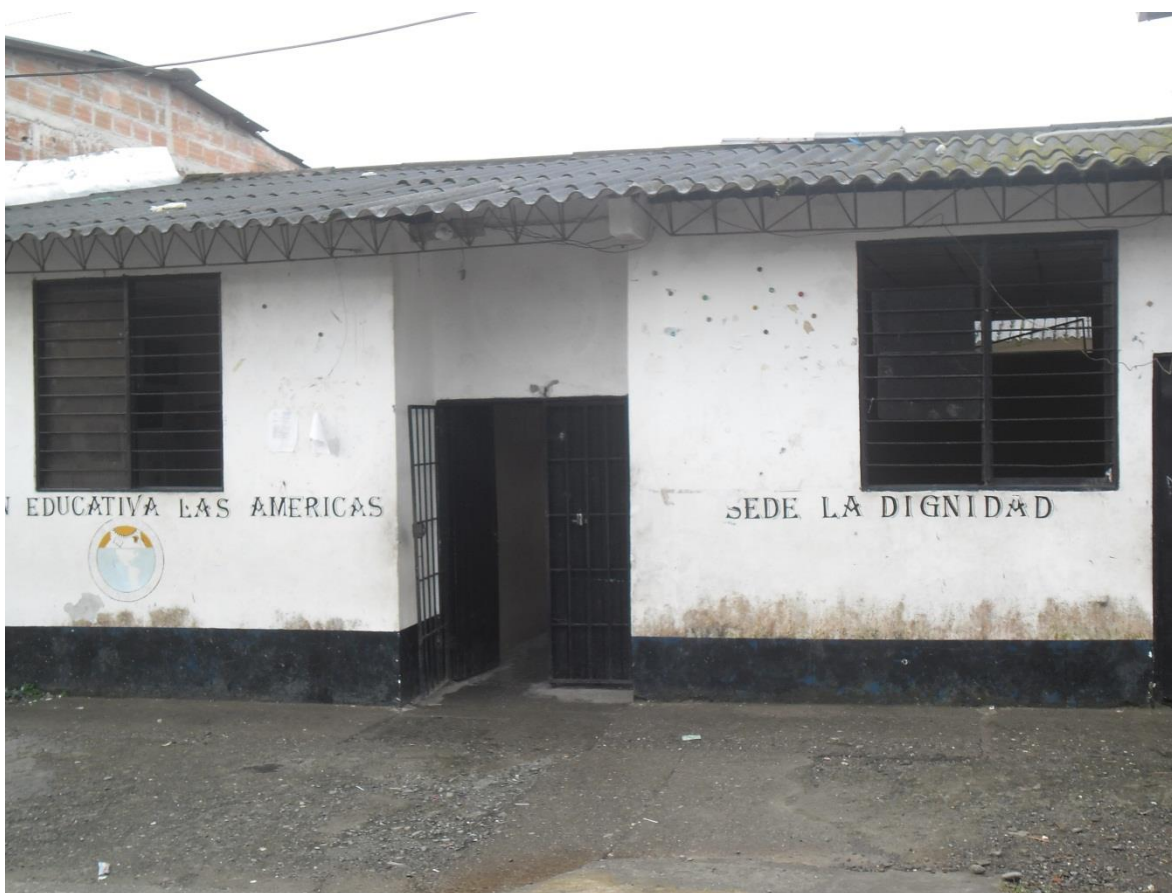
Figura 1 Fachada del Institución Educativa las Américas, Sede la Dignidad de Buenaventura, Valle del Cauca.

La situación del Instituto Educativo las Américas, sede la Dignidad de Buenaventura, es bastante deplorable; su infraestructura se está desplomando. A duras penas aún le queda el nombre en la fachada mostrándole al mundo cuán menesterosa se encuentra.