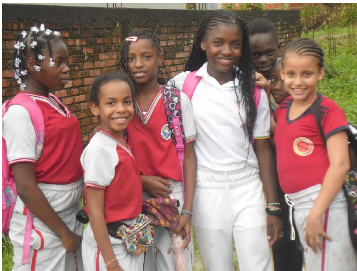
Figura 5. Niñas de quinto que se disponen a marcha a sus casas luego de recibir su jornada educativa.

Son niños que saben la importancia de llevar una vida pacífica dentro de su comunidad, dentro de las aulas de su colegio, por lo que sus maestras no requieren de mucho esfuerzo para hacerles entender cuándo deben guardar compostura, y son felices posando ante una cámara y piden a esa persona que apenas conocen que les tome una foto y ante la cámara muestra la alegría de ser niños y las ganas que tienen de vivir.