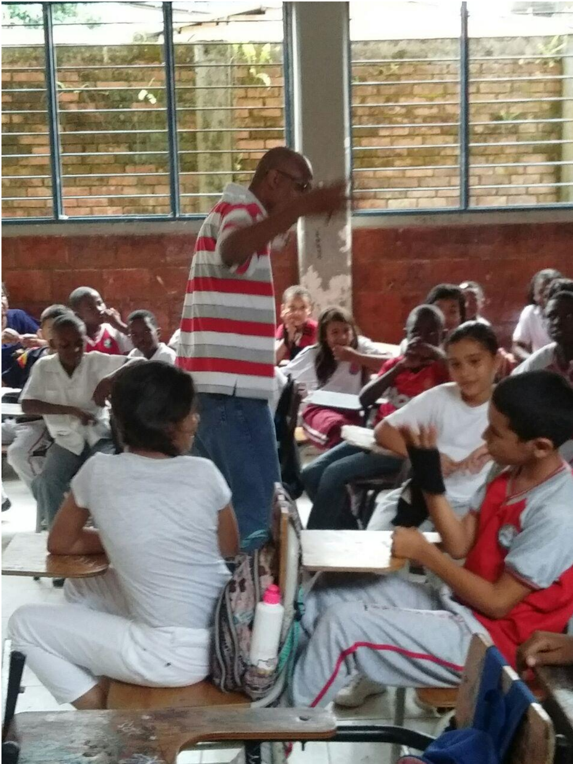
Figura 9. Compartiendo conceptos con a los niños y niñas sobre cultura política, democracia y comportamiento ciudadano.