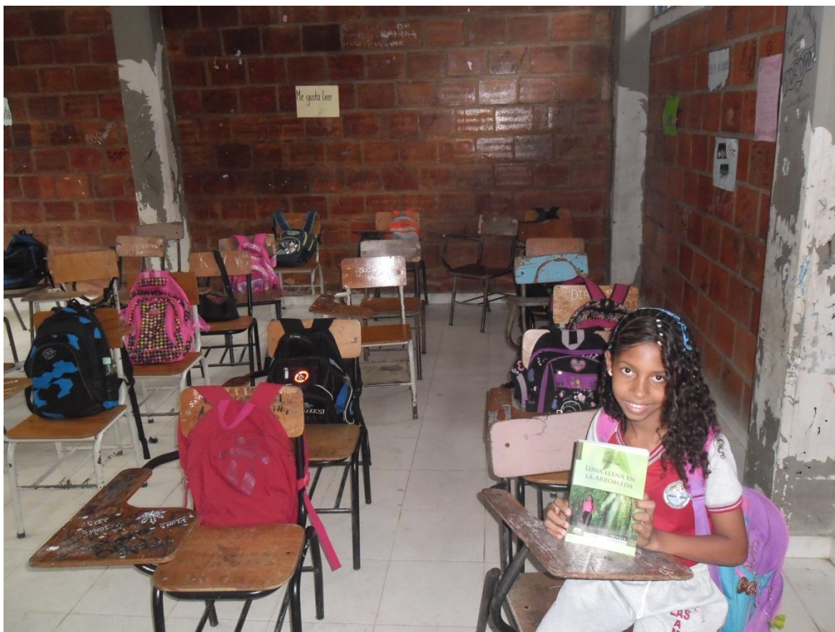
Figura 11. Niña en el salón de clases mostrando un libro novela; Luna Llena en la Arrobleda, de Don Emi.

Desde la perspectiva de estos niños, la política no es sólo para mayores, sino que ellos como niños también deben conocer su funcionamiento que les permita, llegado el momento, ser unos verdaderos protagonistas del acontecer de su nación.