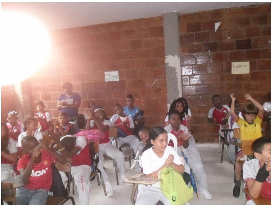
Figura 8. Niños y niñas aplaudiendo después de la elección del personero.

En este ejercicio los estudiantes estuvieron motivados; unos buscando convencer a sus compañeros a que votaran por su propuesta y otros buscando obtener más votos para su candidato y propuesta prefería. Todo se dio dentro de un marco de cordialidad que permitió felicitar y aplaudir a la ganadora.