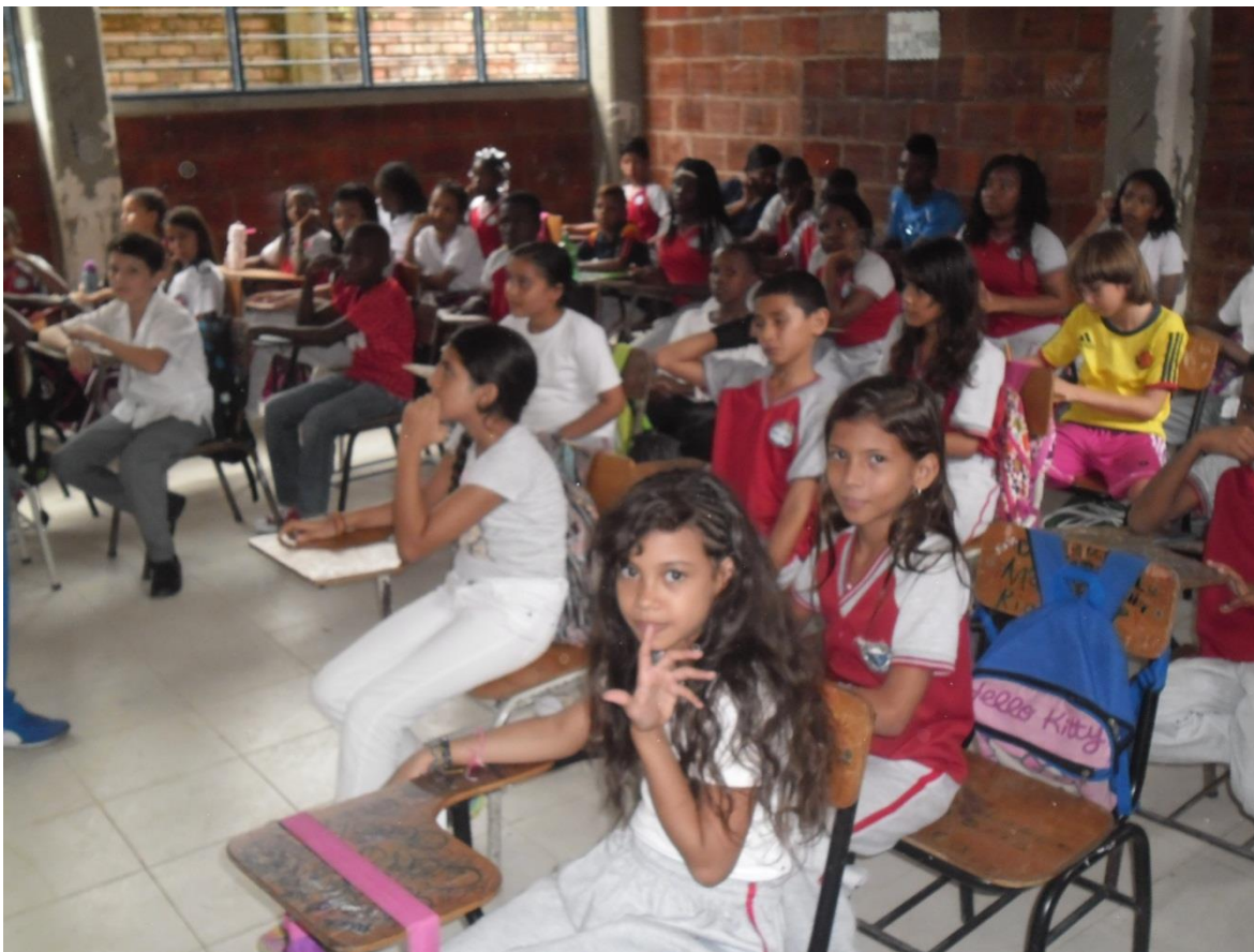
Figura 13. Niños y niñas de Quinto Grado de la Institución Educativa las Américas sede la Dignidad escuchan clases.

Los padres de familia en sus hogares tienen una enorme responsabilidad con sus hijos en cuanto a evitar la discriminación cualquiera que sea. Y es un tema de educación democrática que los niños y niñas aprendan esto desde sus casas, y que esto sea reforzado en las escuelas. En nuestro caso, los estudiantes de Quinto Grado de la Institución Educativa las Américas de Buenaventura, tienen sus propias opiniones ya vividas en sus hogares.