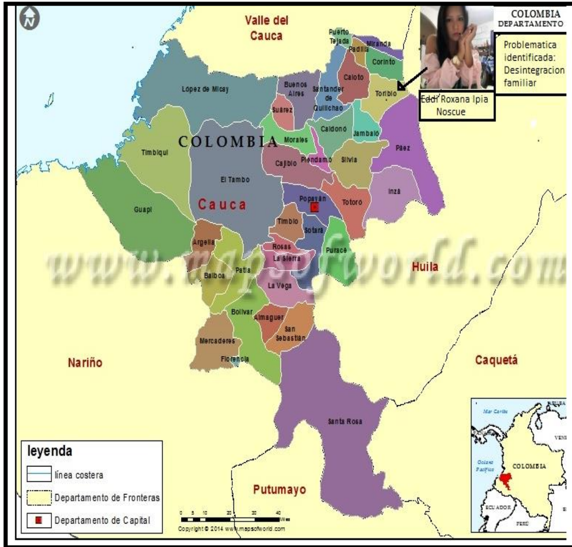
Mapa situacional municipio de Toribio-Cauca