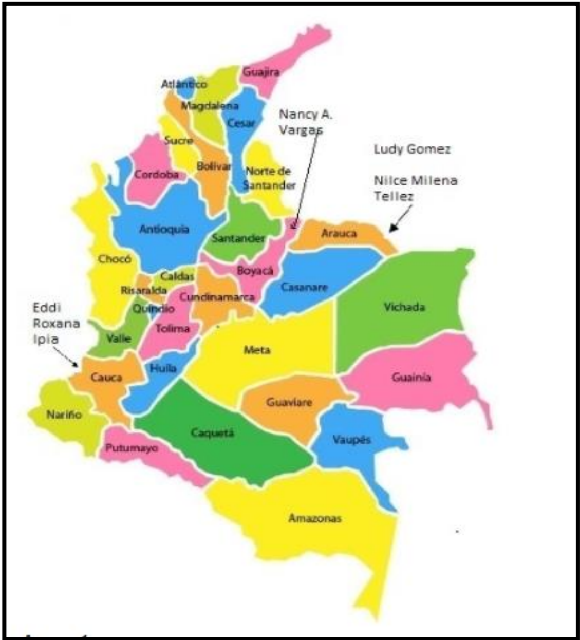
Figura 1 Mapa situacional