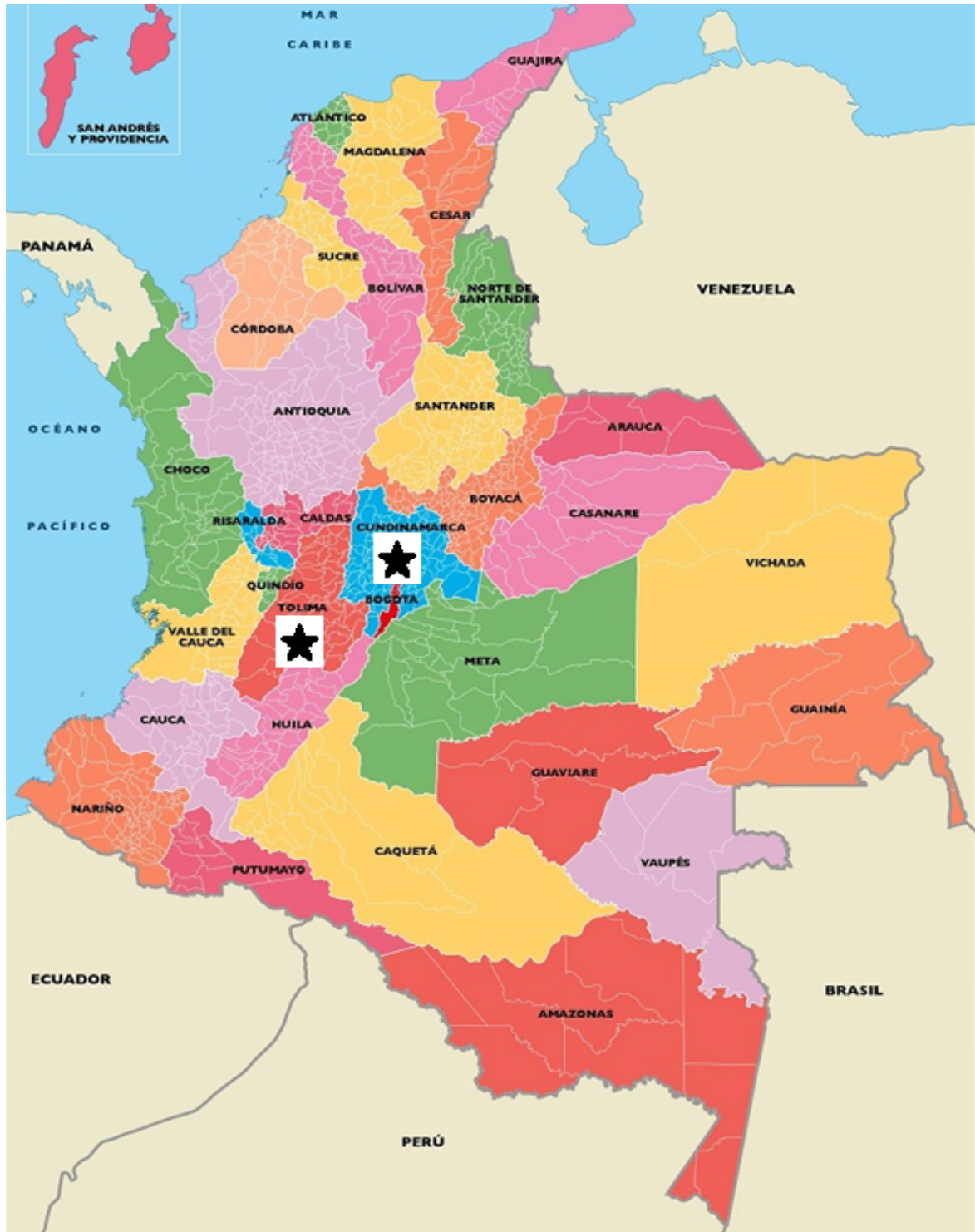
Imagen 1. Ubicación de los departamentos en el mapa de Colombia