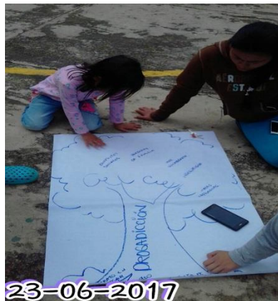
Desarrollo de la Actividad.