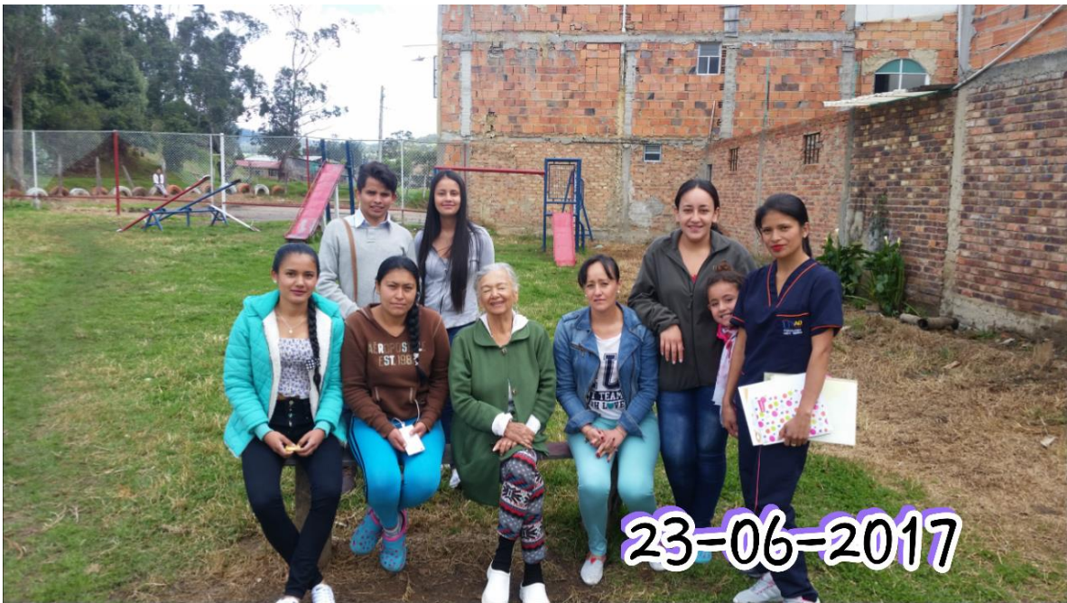
Integración Con la Comunidad de Estudio.