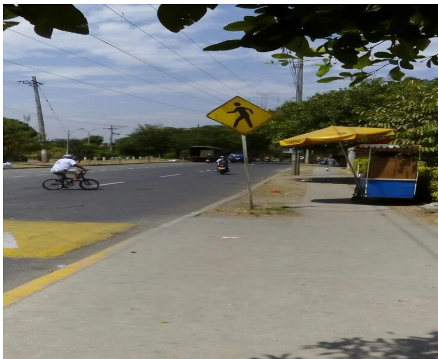
Panorama del barrio