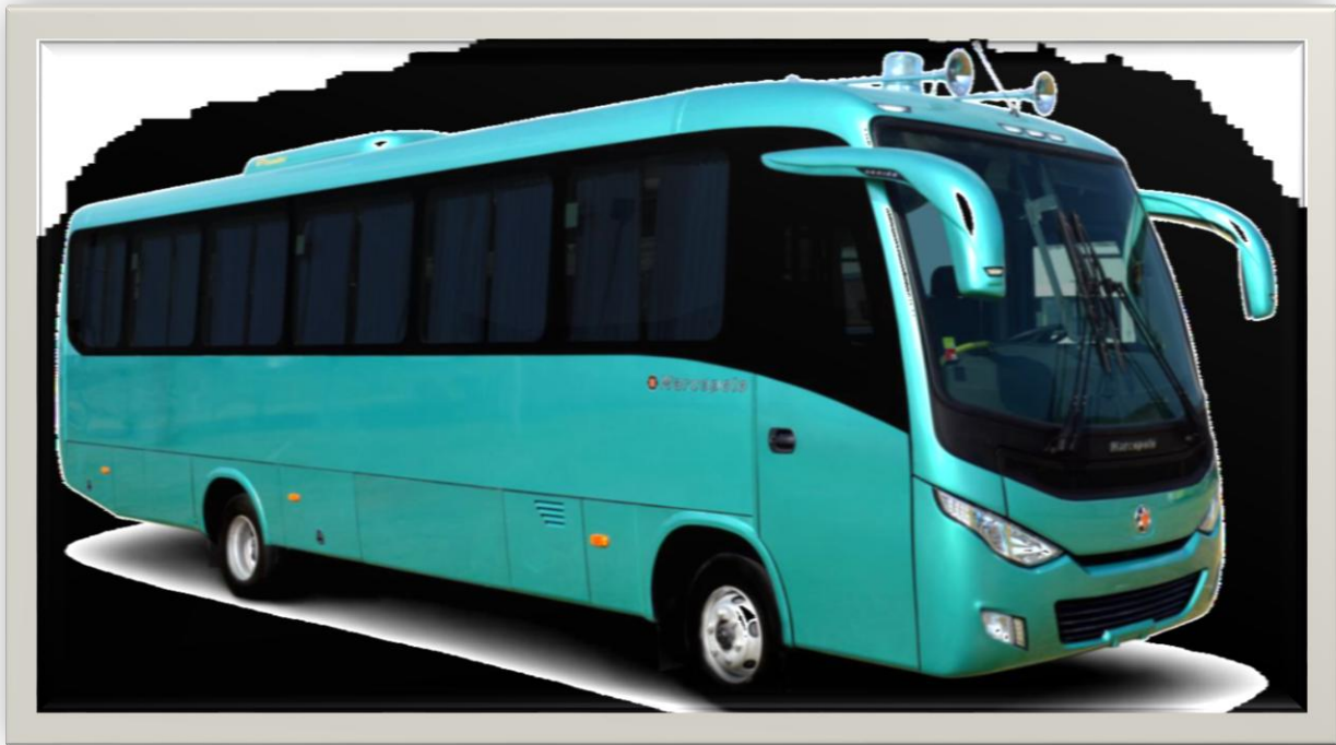
Figura No 2. Carrocería. New Senior