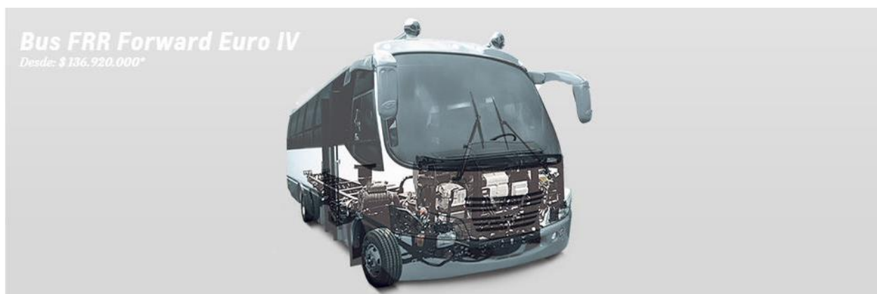
Figura No 1. Chasis.