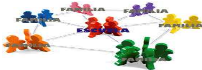
Imagen 1. Familia y escuela.

La propuesta está dirigida a la comunidad educativa del colegio Alfonso López Pumarejo sede B, orientada a los niños, niñas y adolescentes basadas en el diseño de estrategias que permitan disminuir la deserción escolar del plantel educativo.