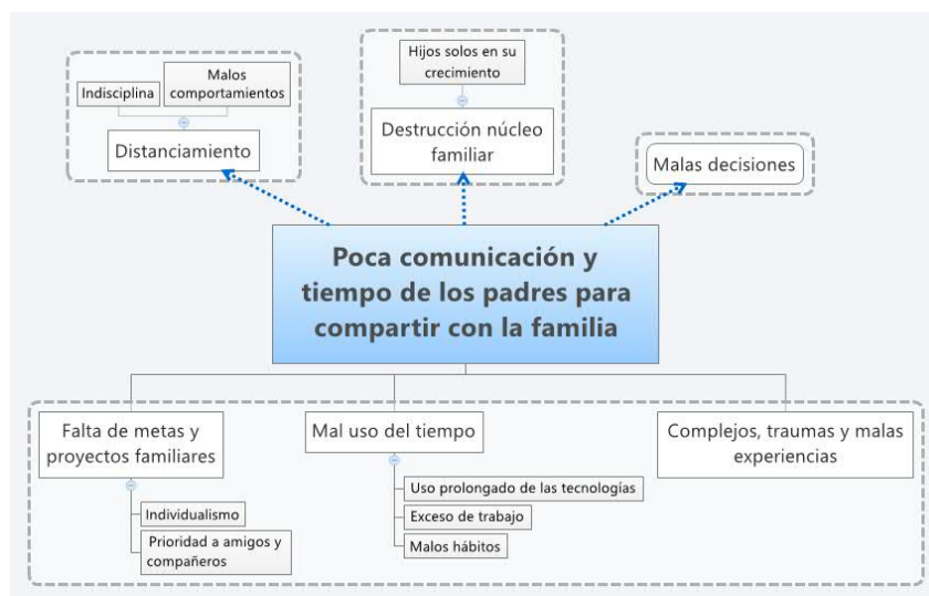
Figura 1 Sistematización Árbol de problemas

Para identificar las problemáticas familiares que se tienen dentro de la comunidad de la Misión Internacional Nueva Iglesia, se utilizó como instrumento de recolección de información una encuesta realizada a miembros de las familias, una entrevista realizada a la líder de la comunidad, un encuentro informal con uno de los líderes de apoyo en la música y educación, el método de observación en cada uno de los encuentros que se tenían con la comunidad, la información recolectada en una actividad de integración con del grupo de liderazgo y la participación de los líderes principales en la técnica del árbol de problemas y objetivos. Dentro de la información recolectada se encontró que las familias que conforman la comunidad no son ajenas a las problemáticas familiares en otros contextos dentro de la ciudad tal como lo presentan los programas que se han venido desarrollando por la Secretaría de Bienestar Social de la Alcaldía de Medellín (Programa Medellín Solidaria, 2010). Sin embargo, se planteó como un problema prioritario dentro de las familias, que es posible intervenir con el tiempo y los recursos que se tienen, la “ausencia y falta de comunicación de los padres con sus familias”. La información de la problemática a nivel familiar escogida se resume en la siguiente figura: