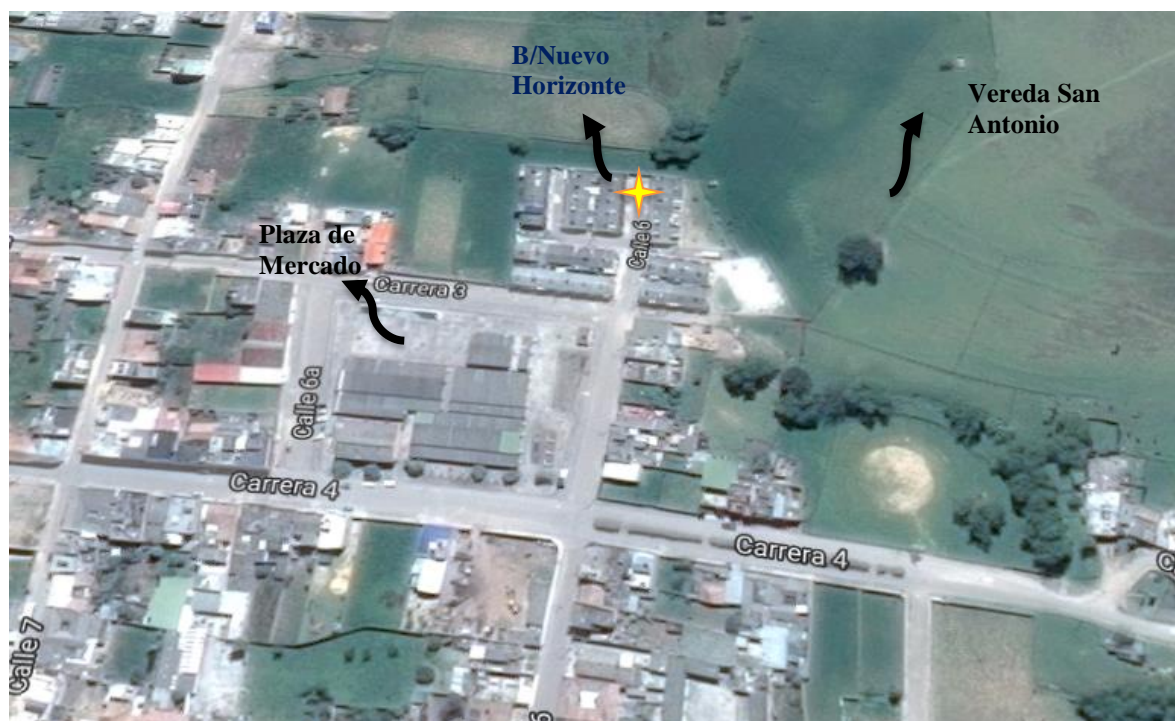
Figura 1 Localización geográfica del B/Nuevo Horizonte en el Municipio de Santa Rosa de Viterbo (Boyacá) indicando sus límites territoriales dentro del municipio fotografía tomada de (Google Maps 2016 ).