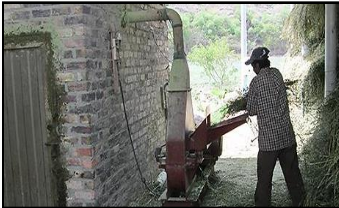
Figura 23. Proceso de la molienda de la Alfalfa ( Medicago sativa )