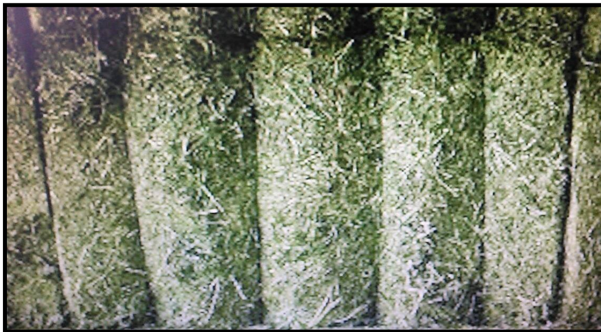
Figura 26. Alfalfa ( Medicago sativa ), empacada, almacenada y lista para comercializar