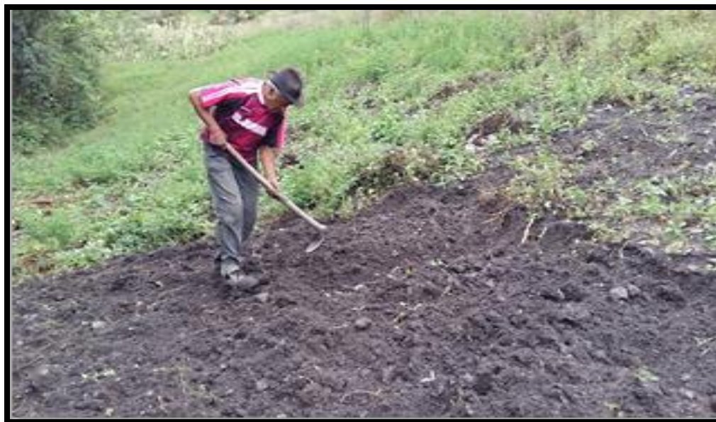
Figura 9. Elaboración de parcelas de parcelas para la siembra