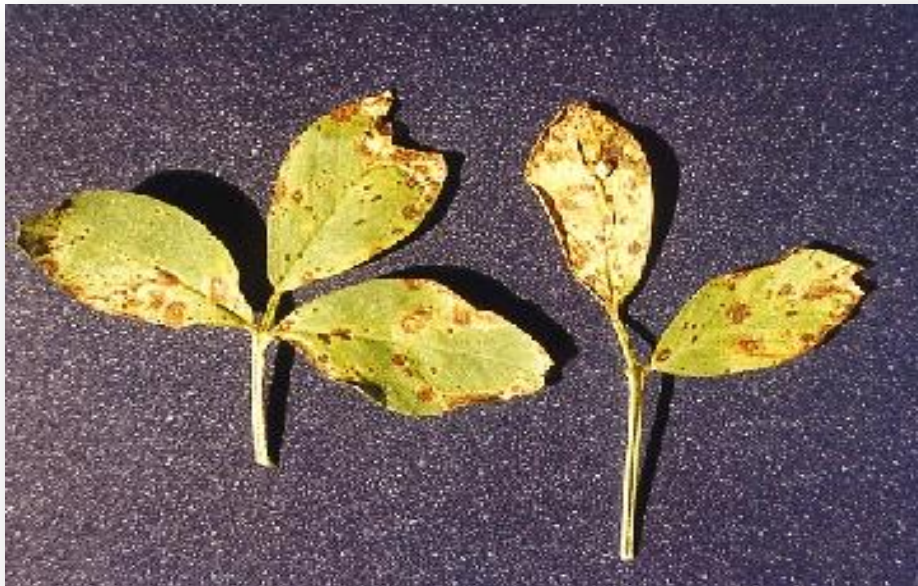
Figura 7. Mancha ocular de roya en la planta.