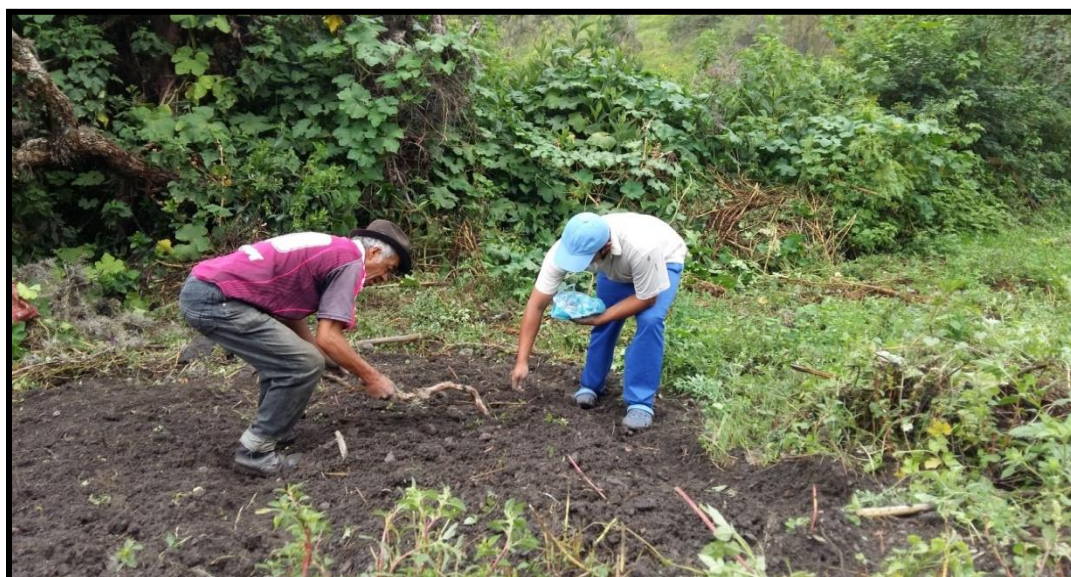
Figura 10. Siembra de Alfalfa ( Medicago sativa ).