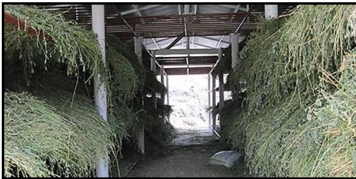
Figura 20. Proceso de almacenamiento de la Alfalfa ( Medicago sativa )