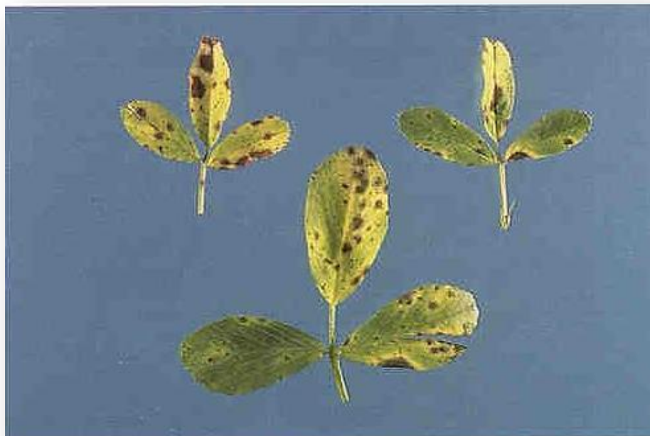
Figura 2. Mancha ocular en la planta.