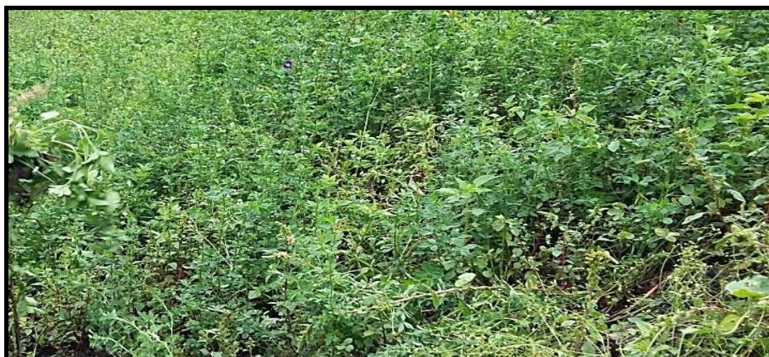
Figura 12. Proceso nacimiento y crecimiento de la planta