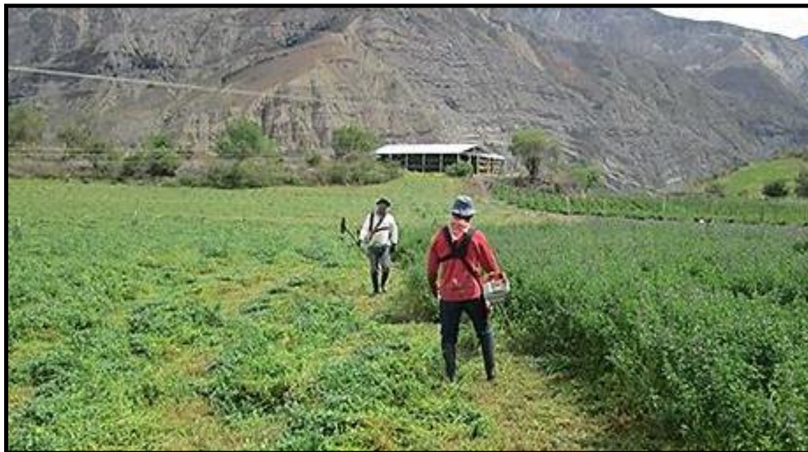
Figura 17. Cosecha de Alfalfa con guadaña (Medicago sativa).