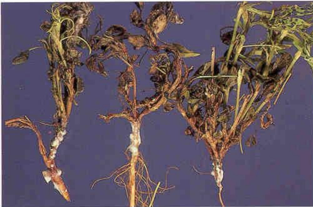
Figure 2. Sclerotinia trifolium crown rot on alfalfa roots and crown.