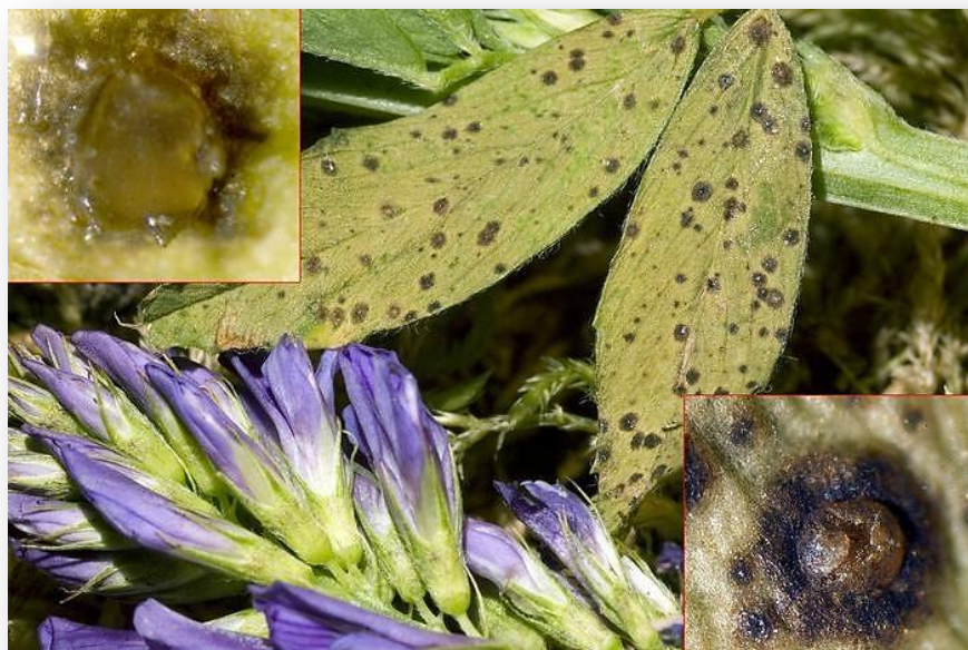
Figura 1. Fotografía microscópica de la viruela

Fuente pseudopeziza medicaginis en alfalfa