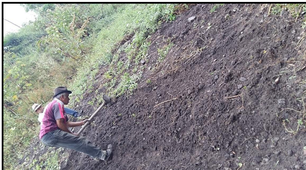
Figura 11. Cubrimiento de la semilla.