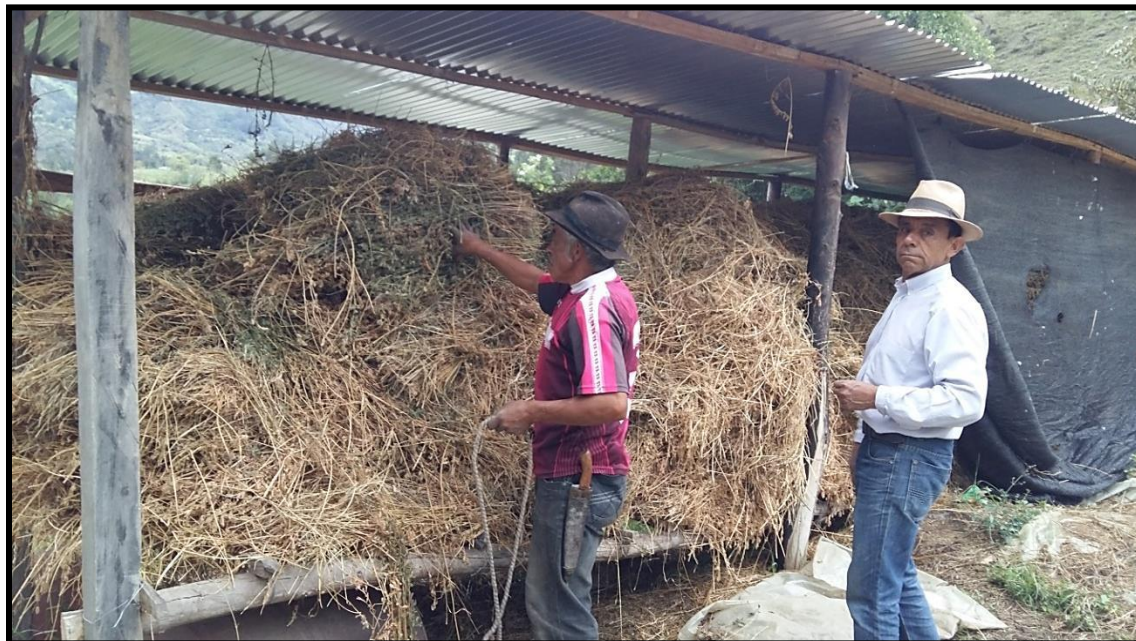
Figura 21. Si queda la Alfalfa seca ( Medicago sativa )