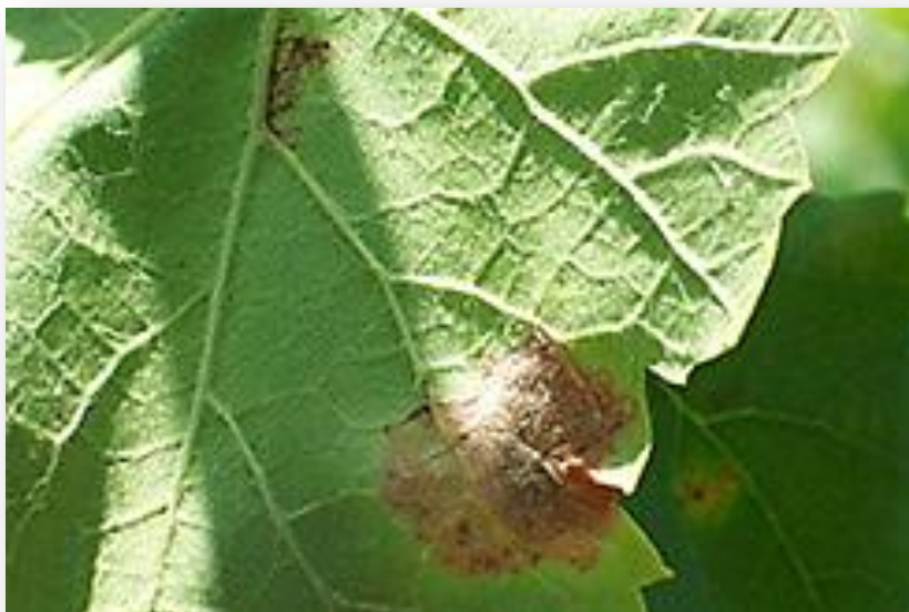
Figura 5. Representación de Mildu