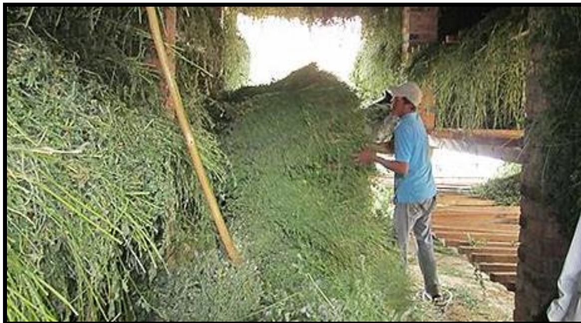
Figura 19. Proceso de la Alfalfa ( Medicago sativa ) en el secadero