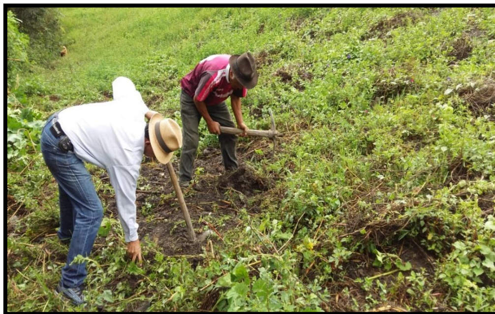
Figura 8. Alistando el terreno para la siembra. Preparación del terreno.

A continuación, gráficamente se explicará en el anterior proceso, para una ilustración mejor del mismo: