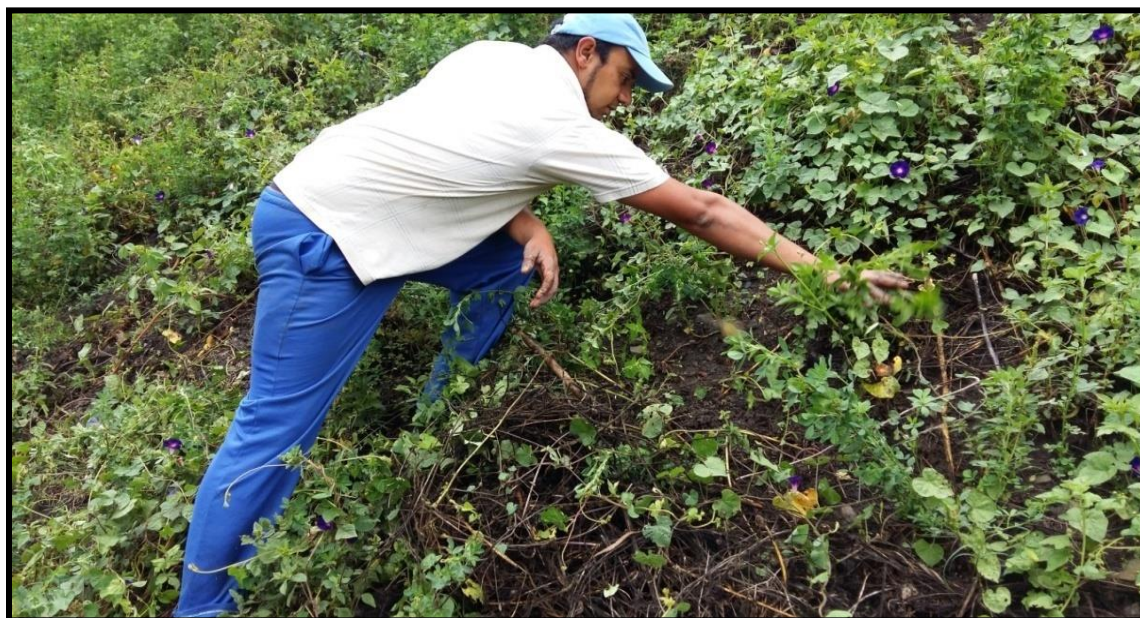
Figura 14. Proceso de desmalezar el cultivo de Alfalfa ( Medicago sativa )