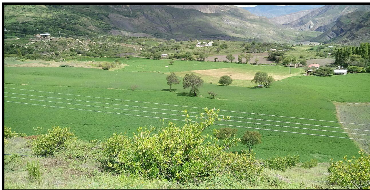
Figura 18. Transporte de la Alfalfa ( Medicago sativa ) al secadero