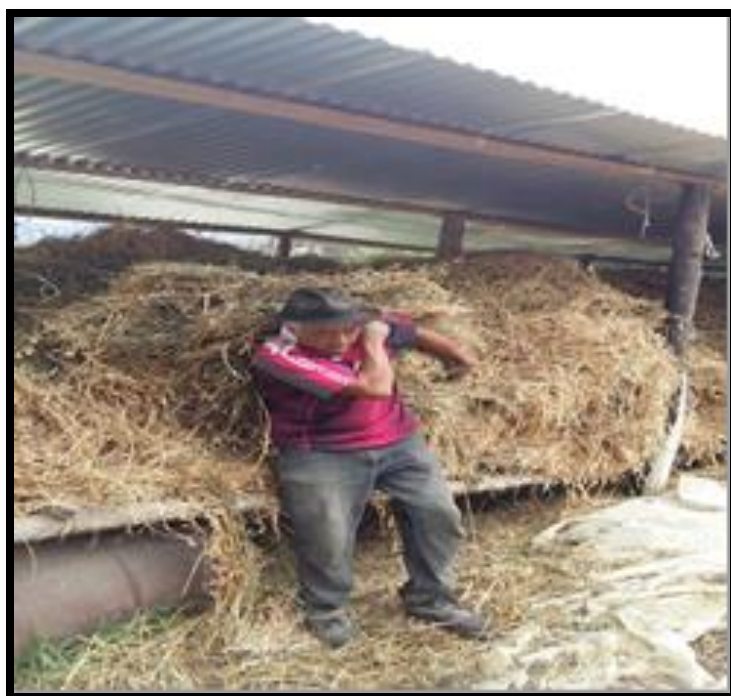
Figura 22. Cargue de la Alfalfa ( Medicago sativa ) seca hacia el molino