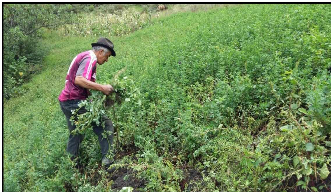
Figura 16. Cosecha manual de la Alfalfa ( Medicago sativa )