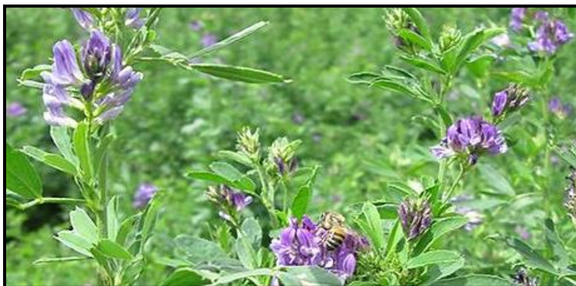
Figura 13. Floración de la Alfalfa ( Medicago sativa )