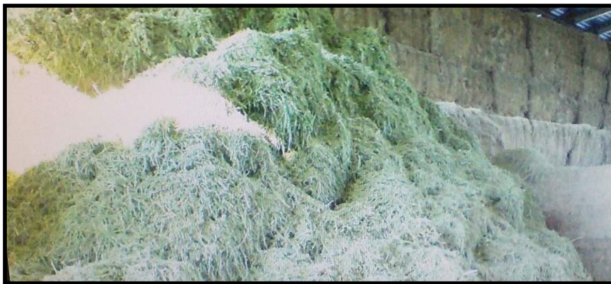
Figura 25. Proceso de empacado de la Alfalfa ( Medicago sativa ).