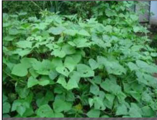
Figura 10. Dolichos lablab