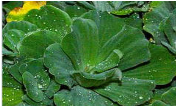
Figura 19 Pistia stratiotes