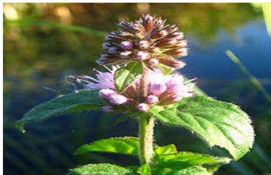
Figura 17. Mentha aquatic