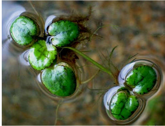
Figura 15. Limnobium laevigatum