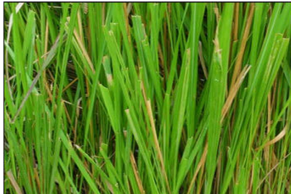
Figura 30. Crysopogon zizanioides