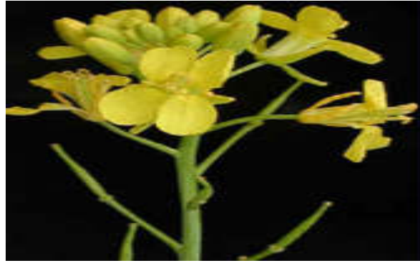
Figura 6. Brassica juncea