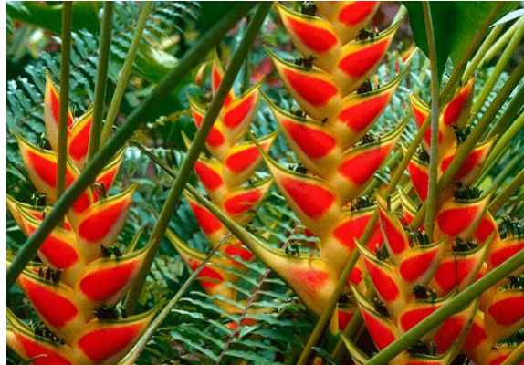
Figura 13. Heliconia