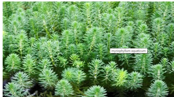
Figura 18 Myriophyllum aquaticum