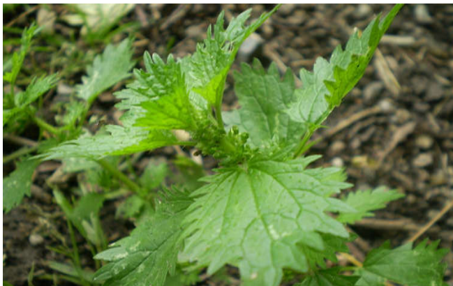
Figura 28 Urtica urens