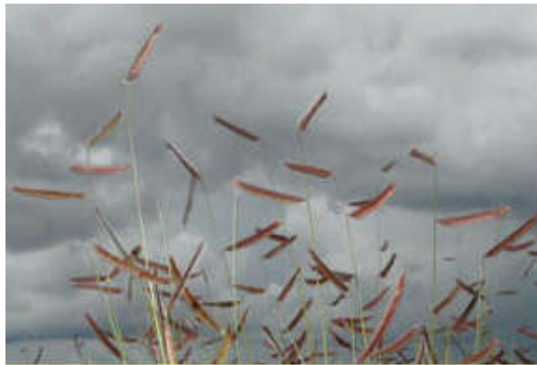
Figura 5. Boutelova gracilis