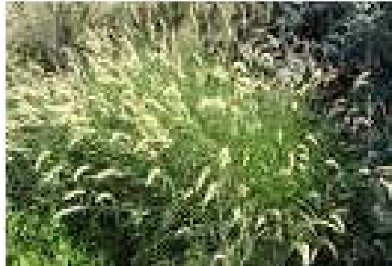
Figura 9. Cenchrus ciliaris