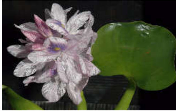
Figura 11. Eichhornia crassipe