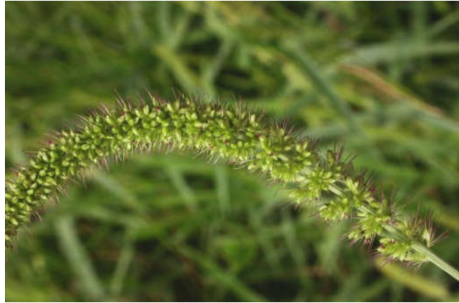
Figura 24 Setaria verticillata L.