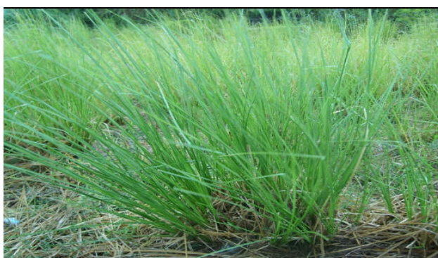
Figura 29. Vertiveria zizanioides