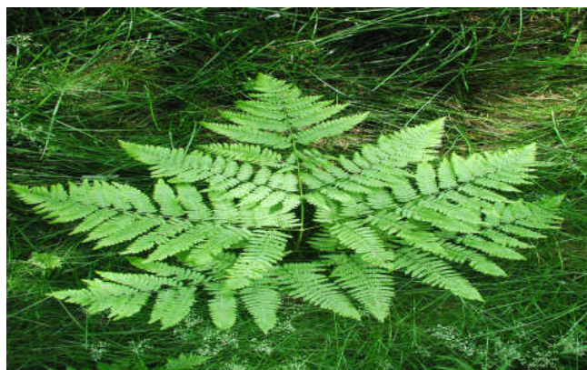
Figura 21. Pteridium aquilinum