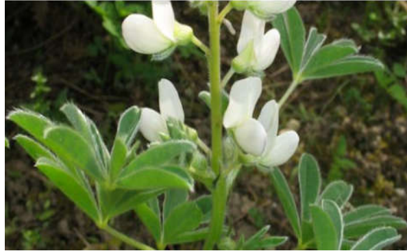
Figura 16. Lupinus albus