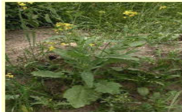
Figura 8. Brassica rapa