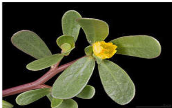
Figura 20. Portulaca oleracea