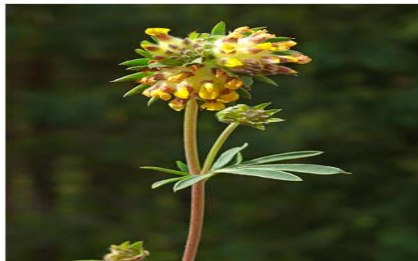
Figura 2. Anthyllis vulneraria