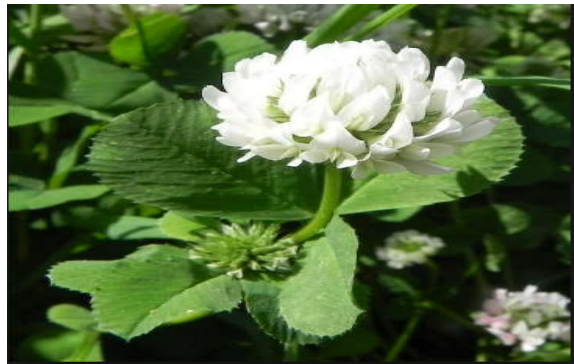
Figura 27. Trifolium nigriscens