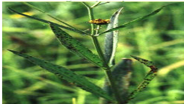
Figura 4. Biden leavis