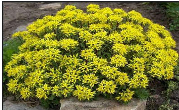
Figura 23. Sedum alfredii