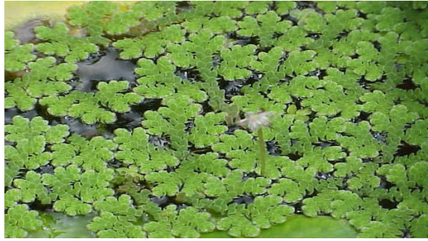
Figura 3. Azolla caroliniana