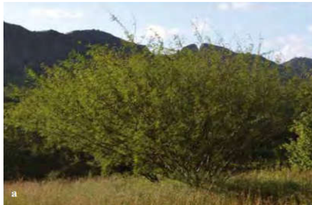
Figura 1. Acacia farnesiana