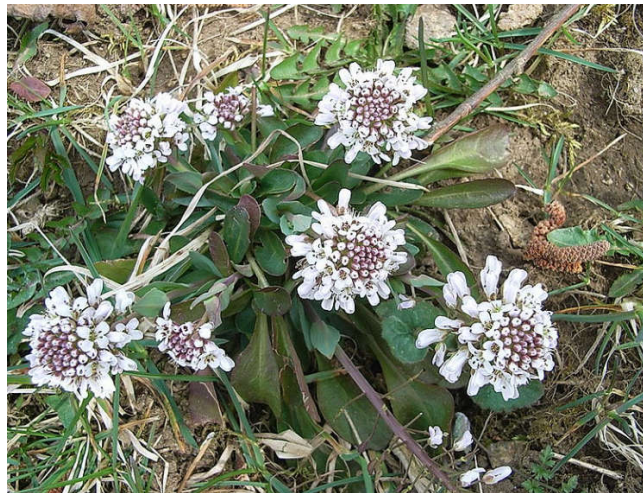
Figura 26 Thlaspi caerulescens