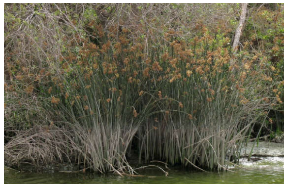
Figura 22. Schoenoplectus californicus