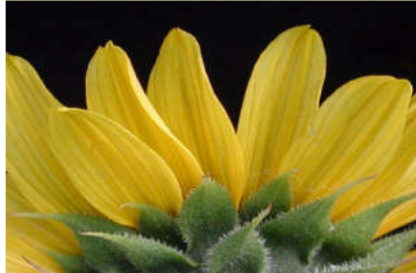
Figura 12. Helianthus annuus