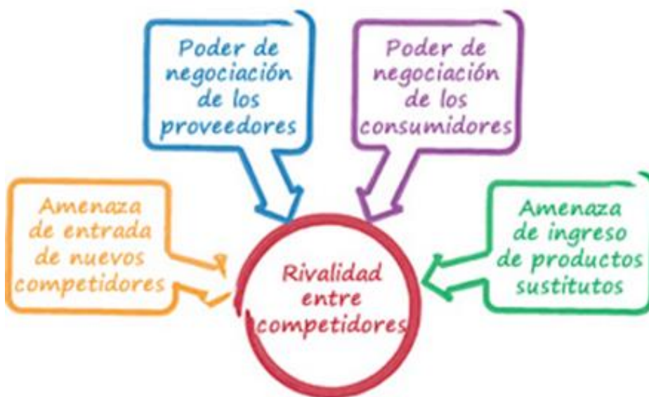
Gráfico 1. Modelo cinco (5) fuerzas de Porter

El modelo gerencial seleccionado es el de las Cinco Fuerzas de Porter, ya que este modelo analiza el grado de competencia que existe dentro de un mercado específico con el fin de desarrollar una estrategia de negocio para la sostenibilidad de la empresa. De acuerdo a las cinco fuerzas de Porter se identifica la competitividad y rivalidad del sector industrial y de esta manera se detectan las oportunidades y rentabilidad de la organización.