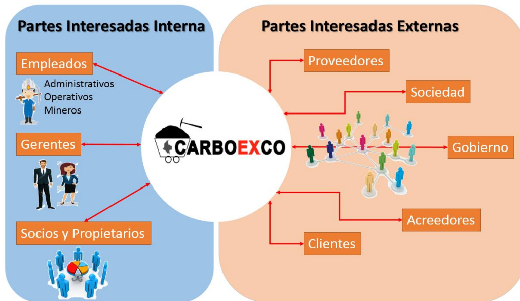
Gráfico 2. Mapa de Stakeholders de CARBOEXCO C.I. LTDA