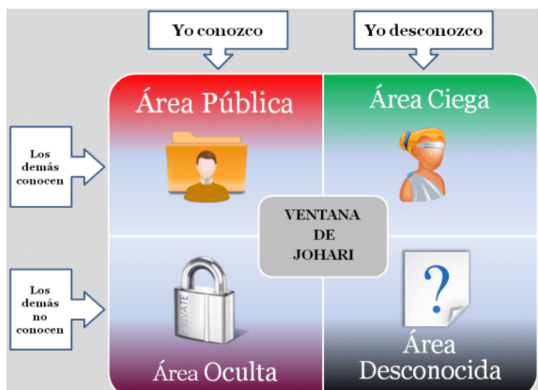
Figura 1 Ventana de Johari

Charles Handy llama a este concepto la casa de cuatro habitaciones de Johari y se muestra en forma de 4 cuadrantes como aparece en el siguiente diagrama.