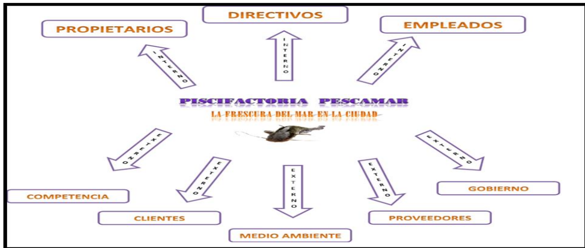
Figura 1 Mapa Genérico Stakeholders. Wilfredo Rodríguez Rodríguez