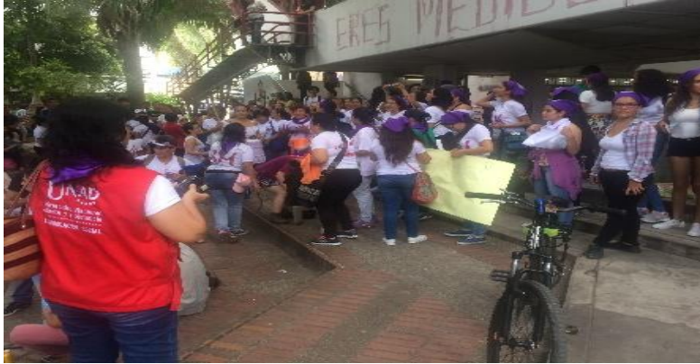
Marcha.8 de marzo 2018.