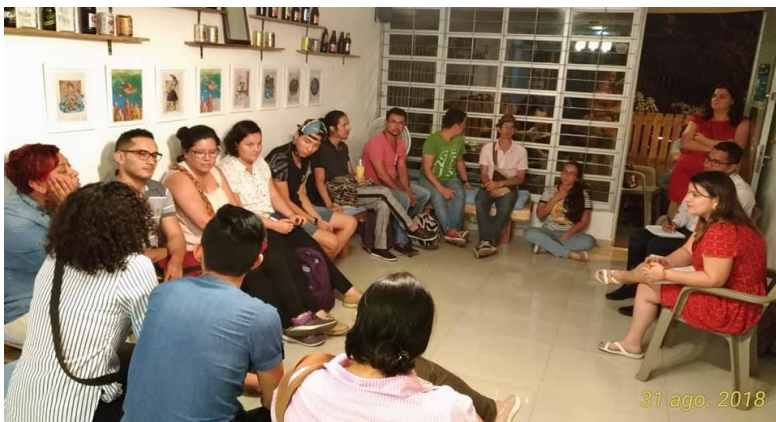
Reunión Fe y diversidad.