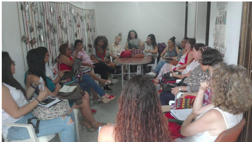
Reunión. Comité impulsor del IX Encuentro departamental de Mujeres