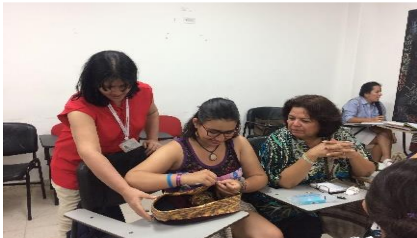
Taller Medios de comunicación. Fuente. Autor