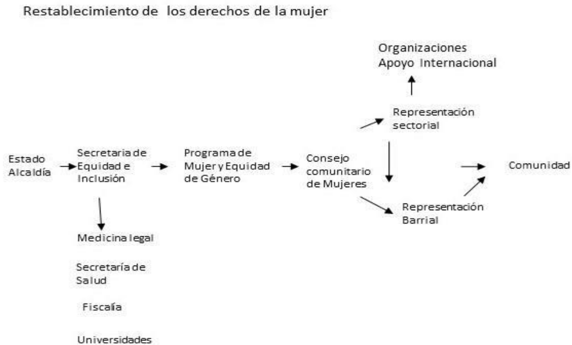
Figura 3. Restablecimiento de los derechos de la mujer.