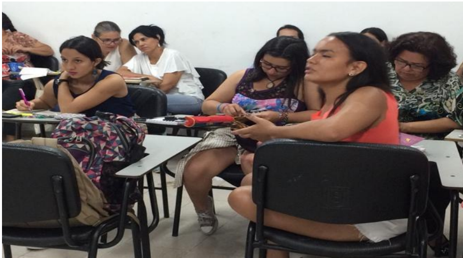
Figura 2. Participantes del Diplomado de Formación para incidencia política.

“La formación la hacemos a través de talleres de escuelas de campesinos, escuelas de liderazgo, escuela para jóvenes rurales, escuelas en derechos humanos”.