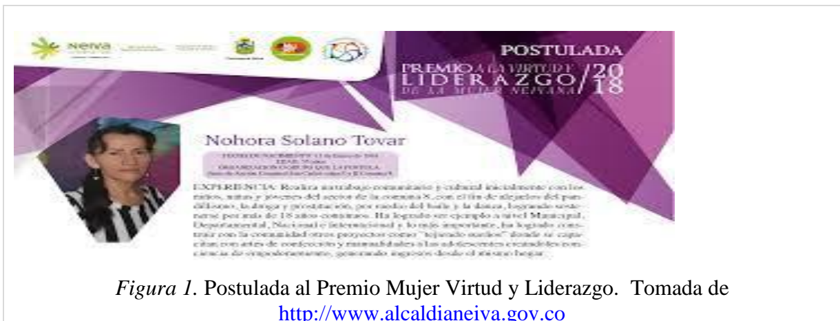
Figura 1. Postulada al Premio Mujer Virtud y Liderazgo.

“Un problema eminente, es el tema de los maltratos; las comisarías no están bien dotadas, dejan acumular muchos problemas y esos problemas hay que resolverlos pronto; necesitamos una casa y se puede hacer”.