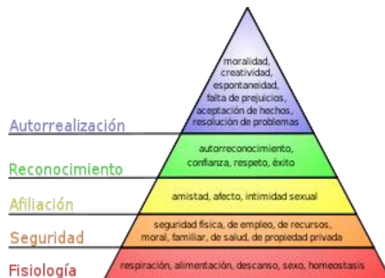
Gráfico 1. JERARQUÍA DE LAS NECESIDADES

Para alcanzar la autorrealización personal, debemos satisfacer las necesidades en el siguiente orden jerárquico: