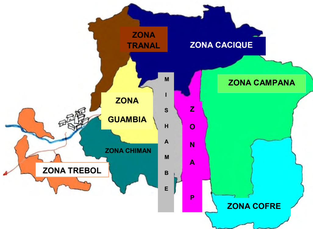
Figura 4. Mapa del Resguardo de Guambia,

El Resguardo Indígena de Guambia, está conformado por las veredas: El Cacique, Cofre, Agua Bonita, Piendamó Arriba, Ñimbe, Campana, Pueblito, Cumbre H, Cumbre Nueva, Peña del Corazón, San Pedro, Alto de los Trochez, Puente Real, Michambe, Guambia Nueva, Santiago, Tapias, Bujios, Villanueva, Alpes, Tranal, Juanambu, San Antonio, Santa Clara, Laguna, Gran Chimán y Marqueza. 2