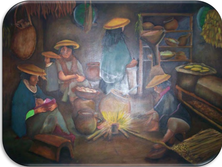
Figura No 12. El Nachak de los Mayores- cocina antigua,