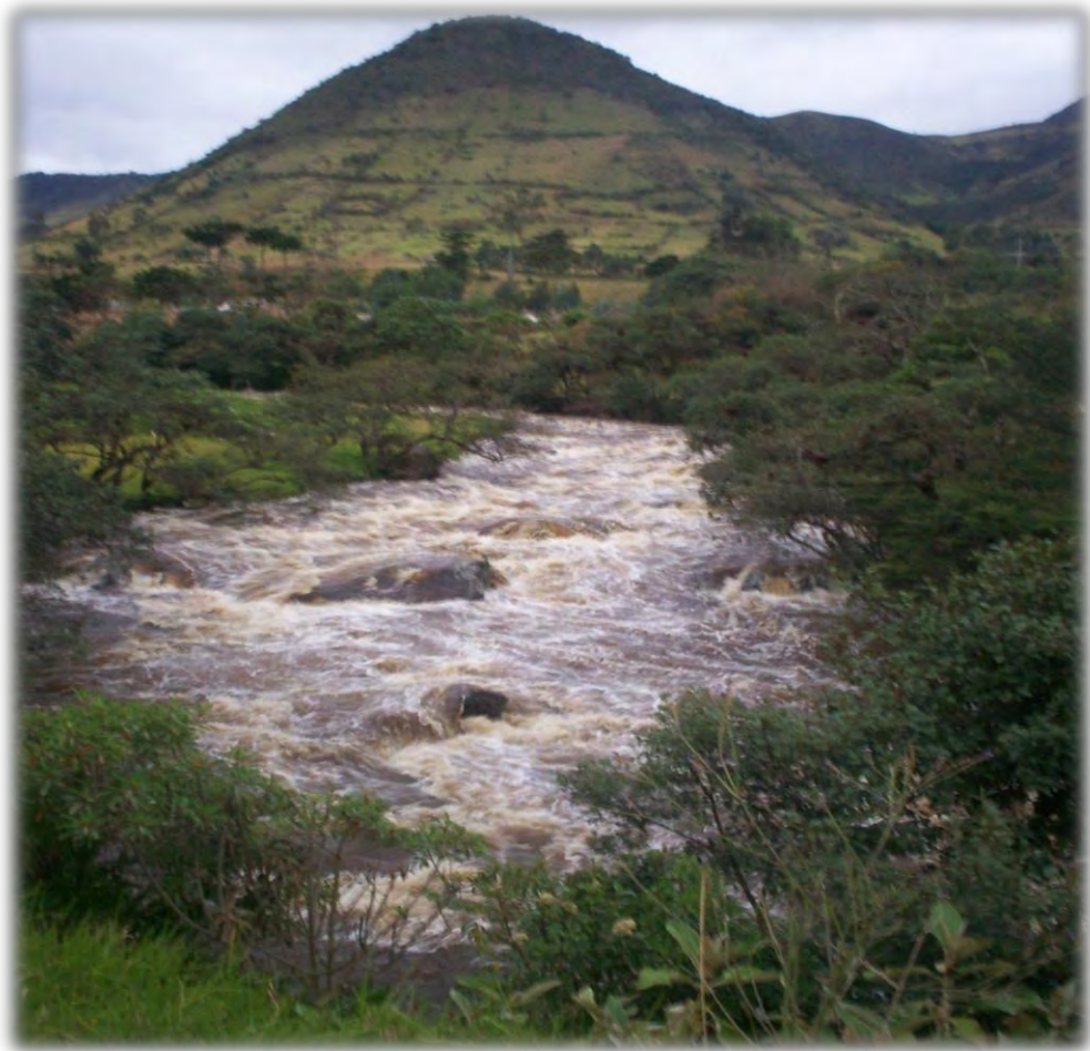
Figura 6. Kausrenpi