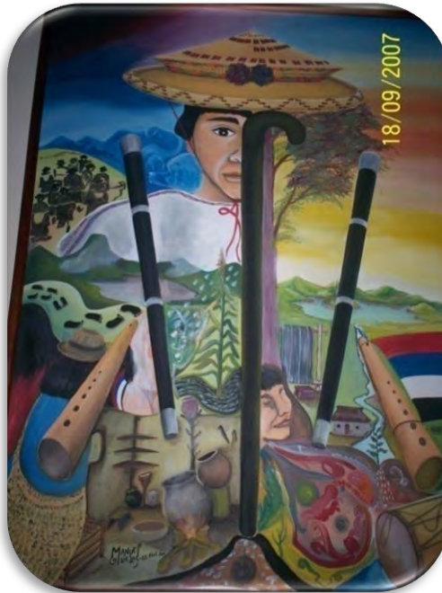
Figura 21. El kansre - otra vida,

agonizar, durante ese tiempo la familia siente y ve que es el tiempo propicio para apoyar de manera solidaria haciendo constantes visitas al enfermo y con regalos a la familia.