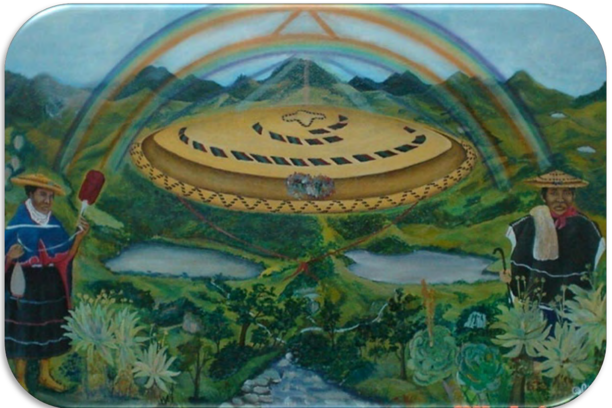
Figura No 7. Recreación artística Origen del Misak