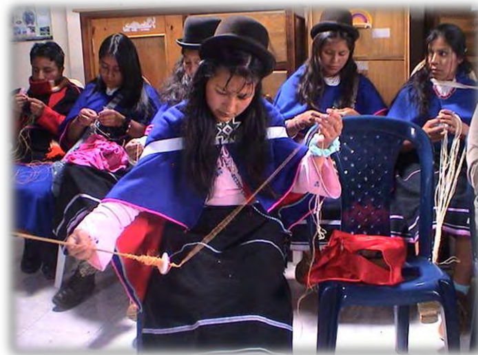
Figura No 18. Mushera ute- juventud

Entre la etapa de los 9 y 11 años aproximadamente los consideramos como niños grandes, en este tiempo es importante la relación del padres con los hijos hombres para la enseñanza del trabajo en el yatul - huerta y la madre con sus hijas mujeres en la enseñanza de los oficios del nachak -cocina y el arte de los tejidos. A esta edad los hijos son activos en la casa ayudan permanentemente en los distintos mandados y oficios como en el cuidado de los animales, en la preparación de los alimentos, en el cuidado de los hermanitos menores contribuyendo en la economía familiar.