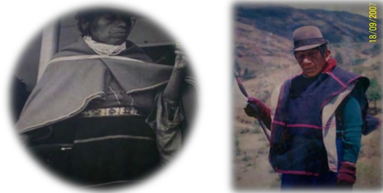
Figura 20. Los mayores son nuestros sabios.