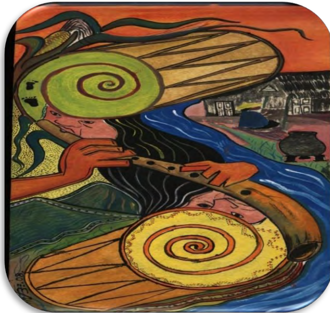
Figura 9. Misakpe tsimaiwan ippe pichip katθ kirrøp inchipik,