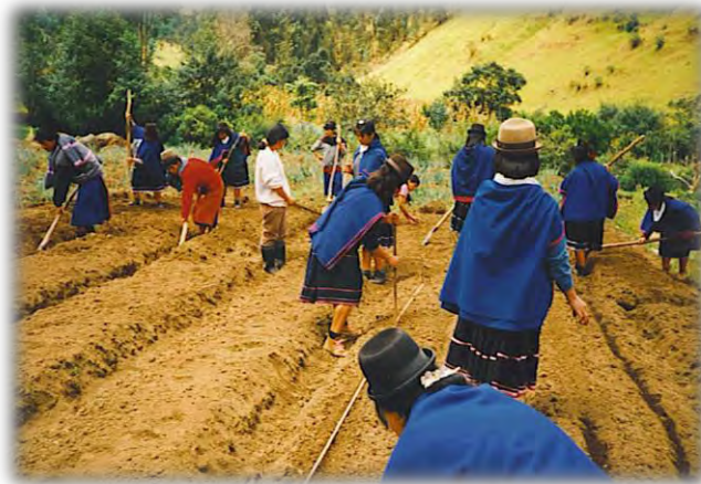
Figura 23. La minga, significado de solidaridad.