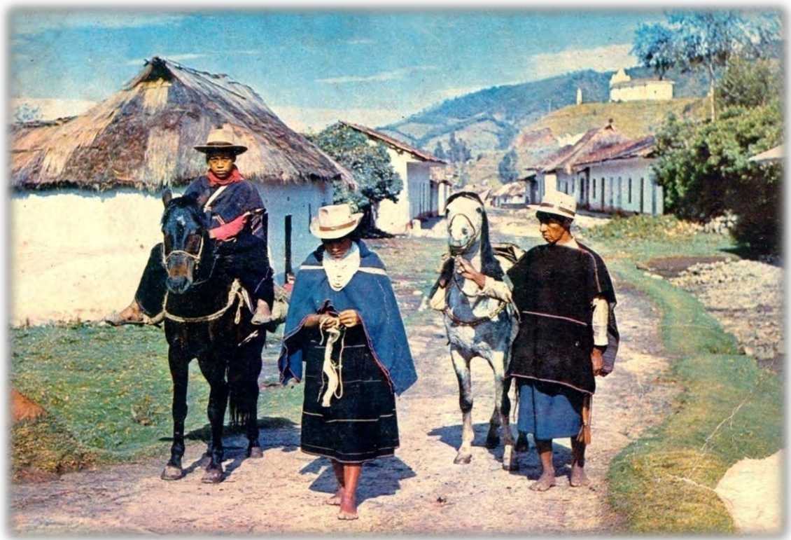
Figura 5. Metrap Misak – Los Mayores fueron, son y serán la historia,