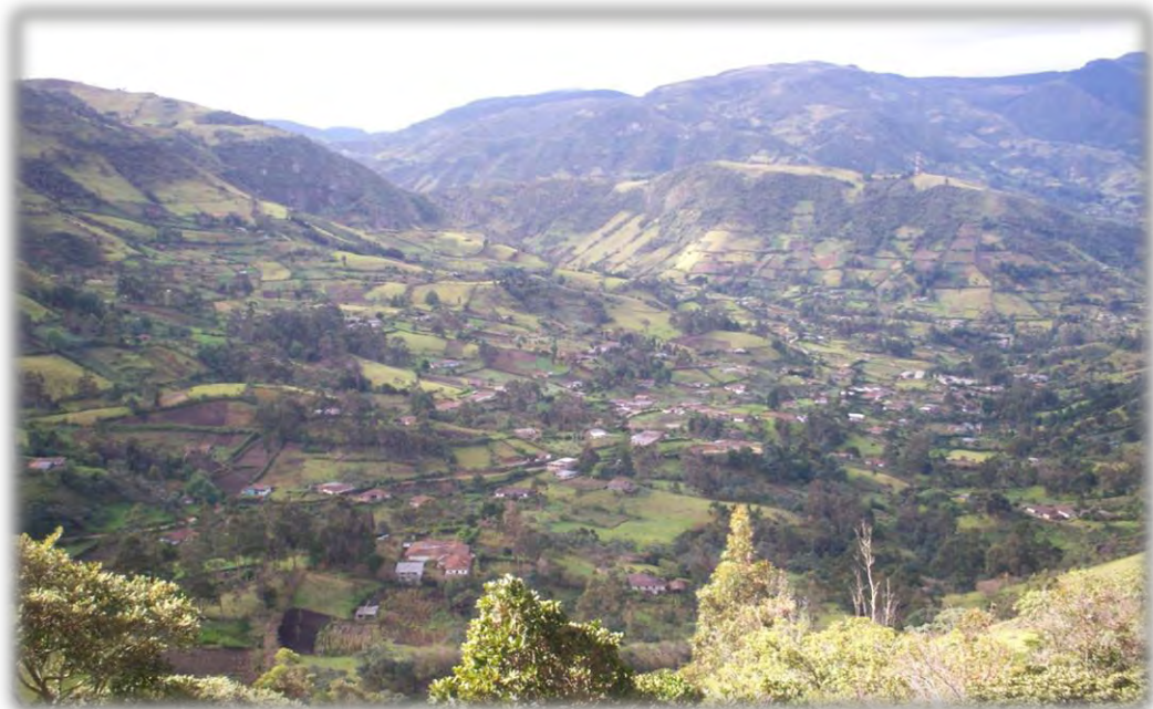
Figura 3. Vista Panorámica Vereda Anisr kullu-El Cacique, Guambia