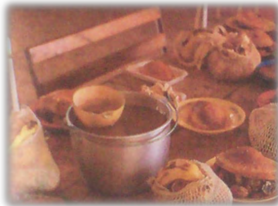
Figura 22. Pipik pensrep - La ofrenda, el espíritu de los alimentos.