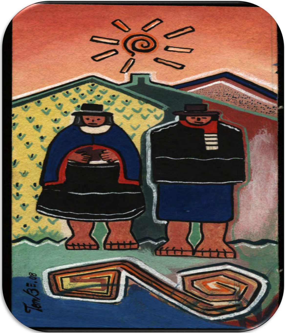
Figura No1. Recreación artística Relación Hombre Naturaleza,