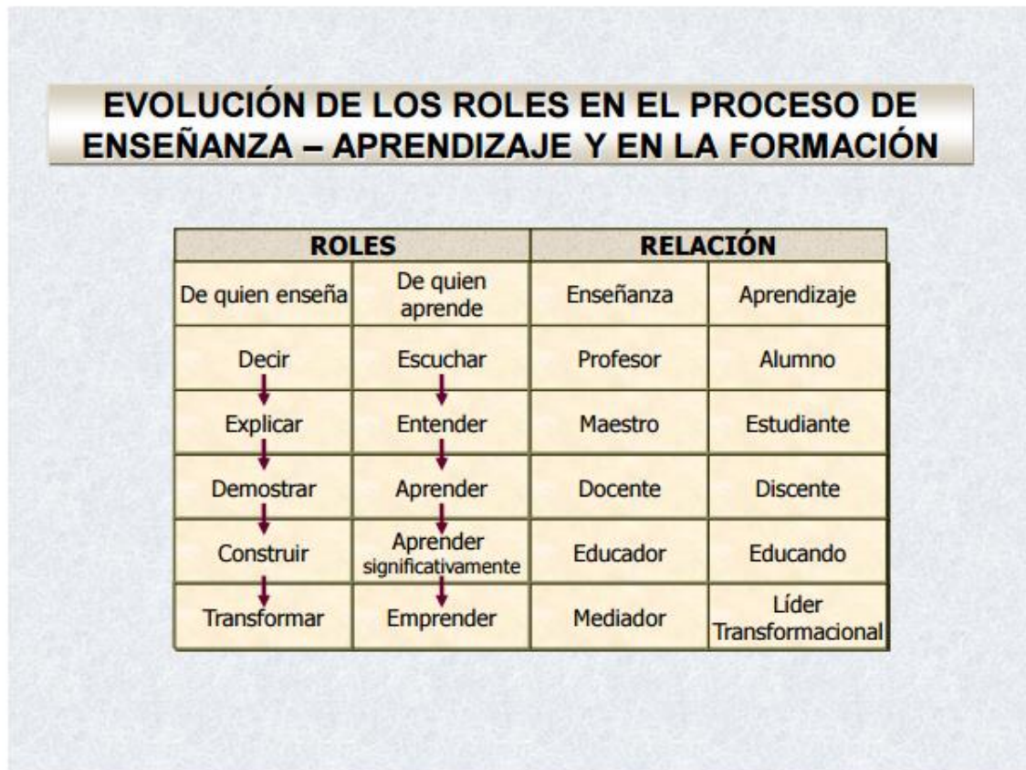
Figura 1. Evolución de los roles en el proceso de enseñanza – aprendizaje y en la formación. (Ianfrancesco, 2015. P .3).