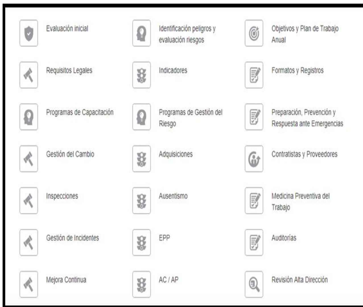
Tabla 1. De Señalización