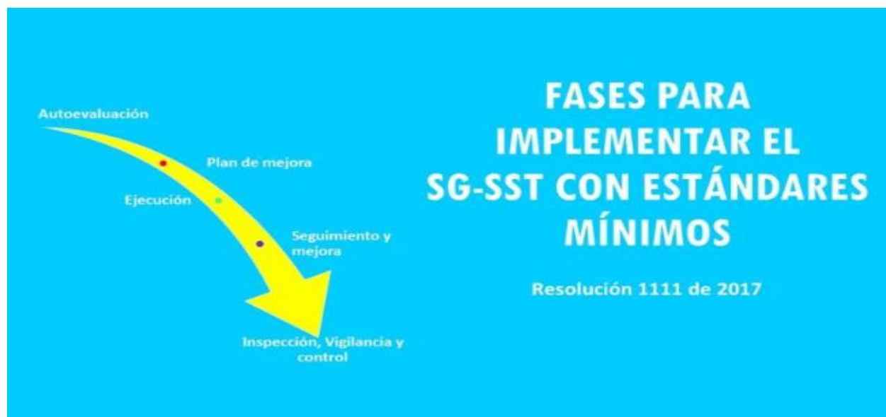
Tabla 2. Fases para implementar el SG-SST