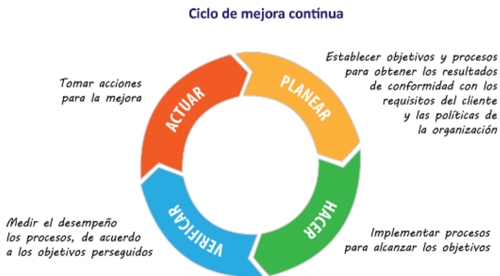
Tabla 4. Ciclo de Mejora Continua

va de enero a marzo de 2018, se realizará la autoevaluación y el plan de mejora del plan ejecutado en 2018 y se incorporará al plan de trabajo anual fijado para 2019.