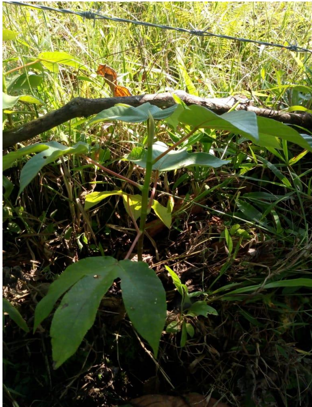
Foto 21. Yarumo Cecropia telenitida

También es ornamental, provee de alimento a la fauna silvestre, restaurador ecológico, y se utiliza para recuperación de suelos degradados.