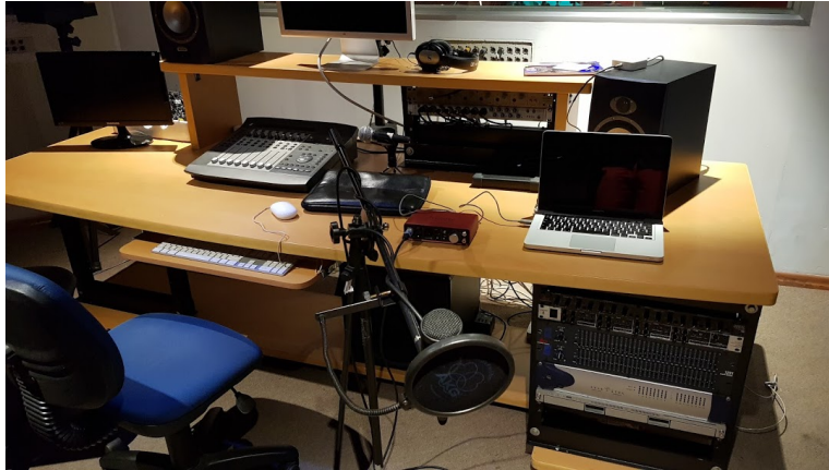
Ilustración 1: Fotografía del estudio de la UNAD