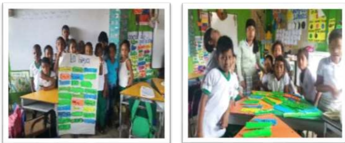
Figura 3. Estudiantes elaborando carteleras sobre valores

Lo interesante es que todos los estudiantes lo toman con muchos respetos y realiza su trabajo con amor y dedicación y a la vez se siente el gran compañerismo de todos en sus labores se ayudan del uno al otro.