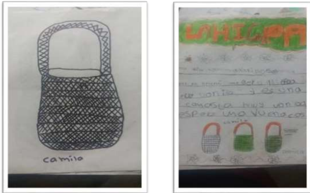
Figura 18. Cuentos y gráficos del tejido de la higrá

El propósito es que los estudiantes investiguen organicen, escriban y expresen sus ideas en la identidad con la práctica del tejido de la higrá.