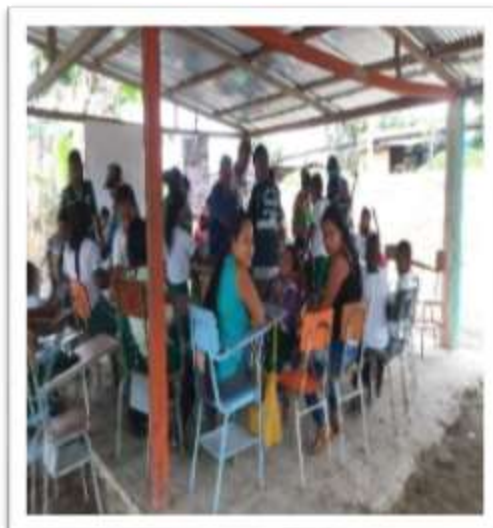
Figura 10. Taller de intercambio de pensamiento y valores

Realizar una salida de campo para valorar la importancia que tiene el árbol de la cosedera donde se reconoce el valor de la naturaleza donde la mujer se conecta por medio del árbol de la cosedera para darle energía positiva por medio de su entono