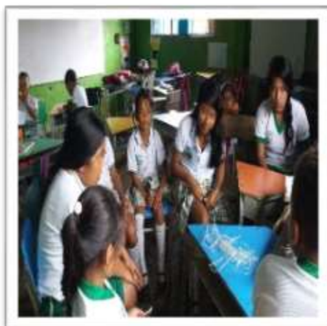
Figura 17. Estudiantes practicando el tejido de la higrá