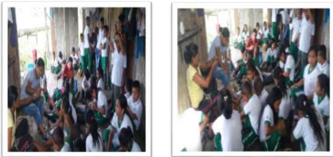
Figura 8. proceso de preparación y torcida de la fibra

Segunda práctica sobre el proceso de la preparación y torcida de la fibra con el conocimiento de la mayor en donde se practica la paciencia de cada una para lograrlo.