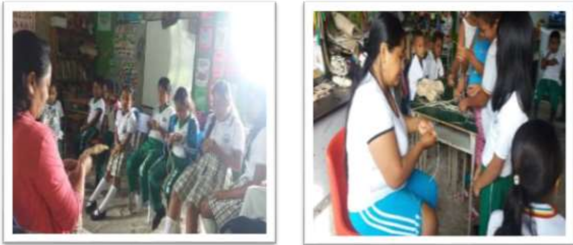
Figura 6. La Mayora enseñándoles el deshilado de la cosedera y preparación de la fibra

Realizar la práctica sobre el proceso de la deshilada de la cosedera y la preparación de la fibra colocando la paciencia y fortaleza de la mujer indígena Awá.