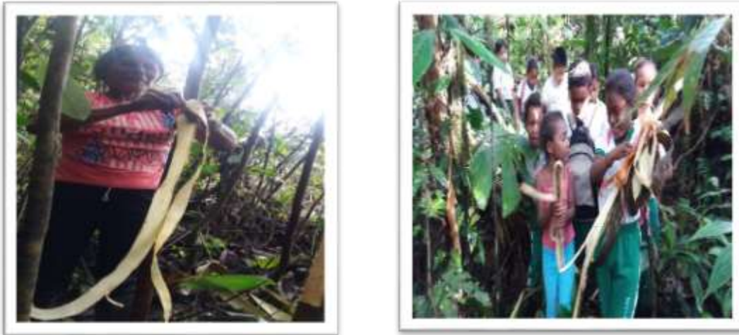
Figura 14. Aprendiendo a sacar la fibra para el tejido de la higrá

Salida pedagógica para realizar el proceso de sacar la cosedera, se observó que los estudiantes se integran con gran compromiso para ejecutar las actividades y dándole relevancia a la fibra que sirve para tejer la higrá. También miramos que al sacar la corteza no se debe cortar el árbol si no se le hace una pequeña cortada en la parte del costado el árbol tiene dos lados y son la barriga y el costado, entonces Alcortá se levanta la punta y se jala con fuerza hasta donde la corteza se rompe, continuamos con sacar la primera corteza para poder majar y lavar.