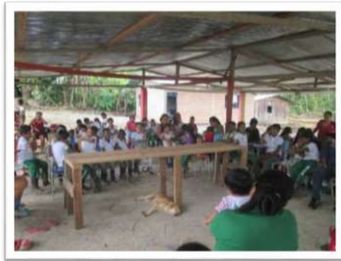
Figura 12. Conversatorio con las mayores

Realizar conversatorio con las mayores sobre los tiempos de luna donde se pueda sacarla cosedera lo cual es de gran provecho para cada estudiante en el aprendizaje sobre los tiempos lunares de nuestra naturaleza.