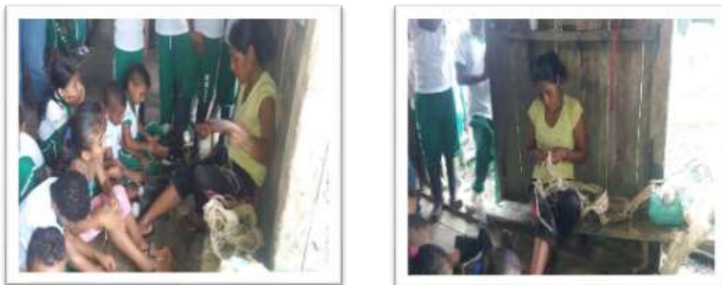
Figura 7. La Mayora enseñando y practicando el proceso de deshilado con los estudiantes

En esta actividad es para el proceso del deshilando la cosedera aquí es donde se practica los valores fundamentales que tiene la mujer indígena Awá guardados y está la paciencia, tolerancia, constancia, compartir, enseñar, tejer.