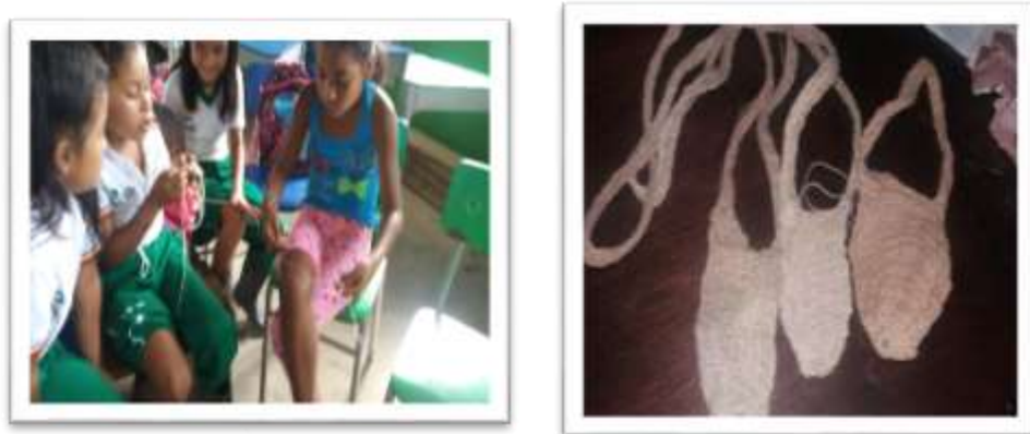
Figura 21. Muestra del tejido de la higrá realizados por los estudiantes