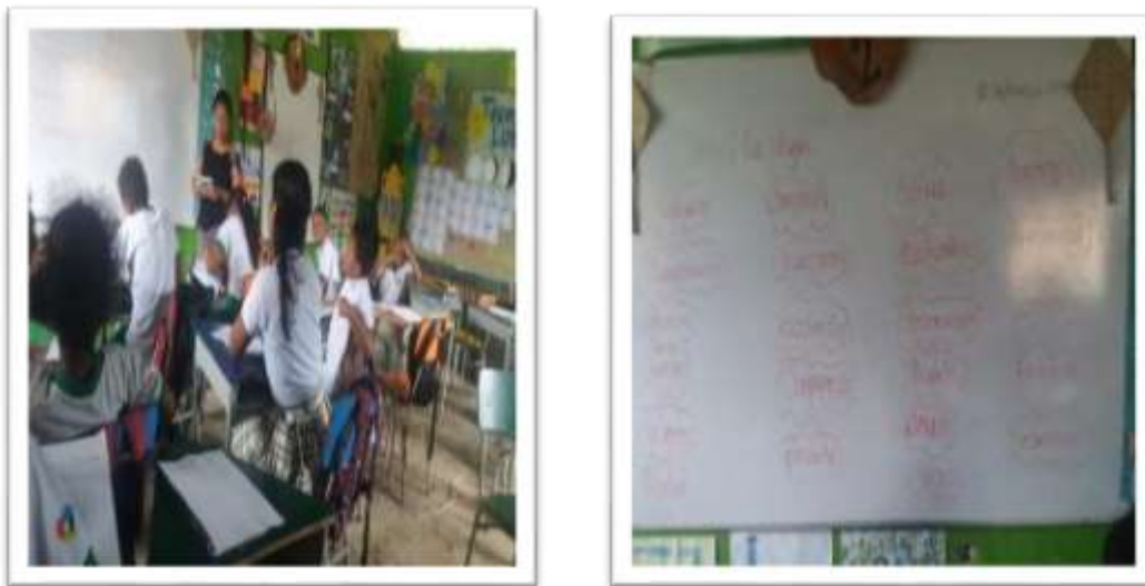
Figura 2. Estudiantes presentando las respectivas carteleras

Los estudiantes realizaron las diferentes carteleras: