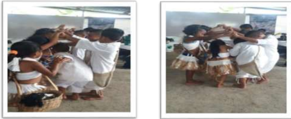
Figura 20. Danza al tejido de la higrá

Actividad Cultural. Con los estudiantes hemos utilizado la cosedera para decorar las faldas de las niñas para el baile de la marimba y la higrá la que llevan los hombres en el mismo.