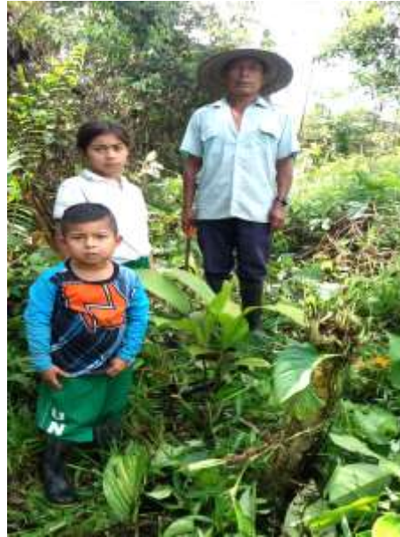
Figura 4. Salida de Campo