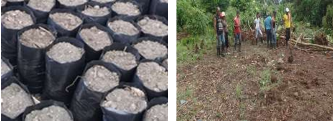
Figura 9. Siembra y preparación del terreno para vivero

recolección de las semillas fue desde el suelo, donde, se observó que la semilla esté sana y en madurez todo esto con la ayuda de un Mayor que conoce del tema.