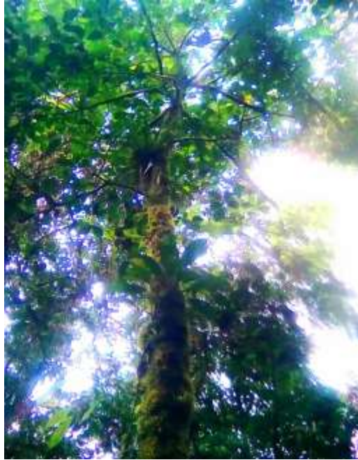
Figura 3. Árbol de Damajagua

encontró a la orilla de una quebrada un árbol de Damajagua (ver figura 3) con una altura aproximada de 10 metros, con la información obtenida y trazando una ruta se prosigue a realizar la salida de campo con los estudiantes.