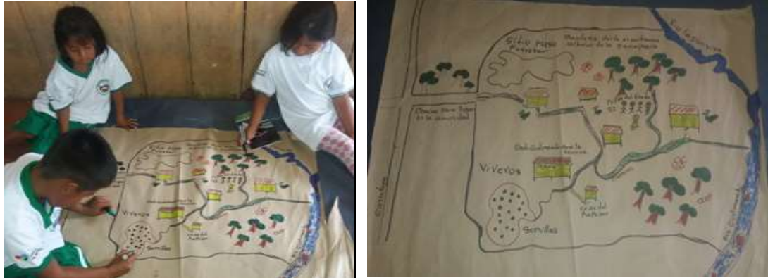
Figura 5. Mapa social