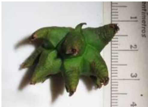
Figura 6. infrutescencia en maduración

Para la actividad de recolección de semillas se contó con la información de los mayores y también de referencias bibliográficas para corroborar y precisar la información; en las figuras 6 y 7 se indican el fruto y la semilla que se encontró en una investigación y que se tuvo en cuenta en la salida de campo.