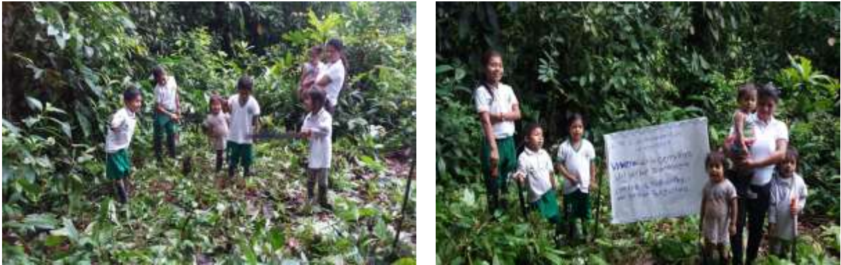
Figura 8. Selección y preparación de vivero

semilla por lo cual fue necesario hacer la respectiva recolección; como los estudiantes del grado segundo son pocos se optó por buscar ayuda de otros estudiantes y padres de familia para la recolección y preparación de terreno (ver figura 8).