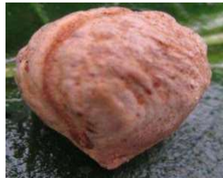
Figura 7. Semilla de Damajagua

Para la actividad del vivero se tiene en cuenta la revisión bibliográfica donde se siguen pautas necesarias para construcción del vivero, en estas consultas realizadas se encontró que el árbol al Damajagua se le puede hacer semillero de dos formas, por semilla o por estaca, pero según otras investigaciones recomiendan hacer el vivero por semilla porque por estaca no les ha dado resultado, con esto se procedió a aplicar el método de