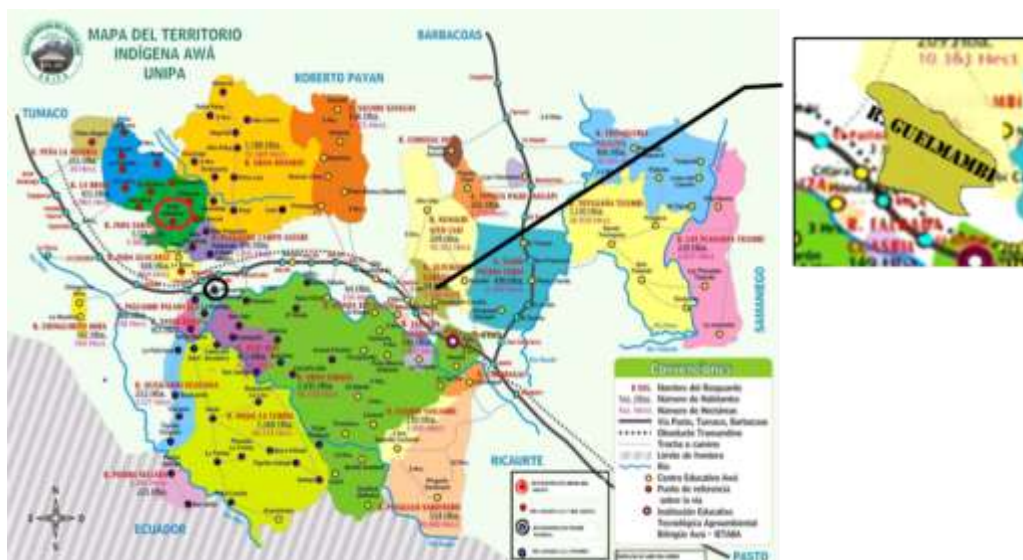
Figura 1. Mapa de los Resguardos UNIPA.

Cuenta con varias quebradas entre ellas El Aguacate y El Mango y ríos denominados La Brava, Guelmambi, Caraño, El Bombo.