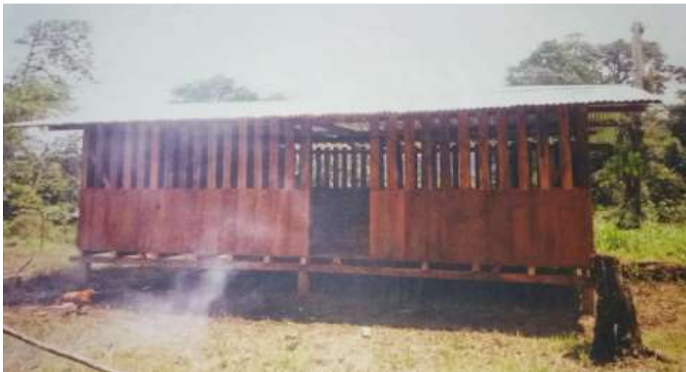
Figura 2. Centro Educativo Guelambi La Sonrisa