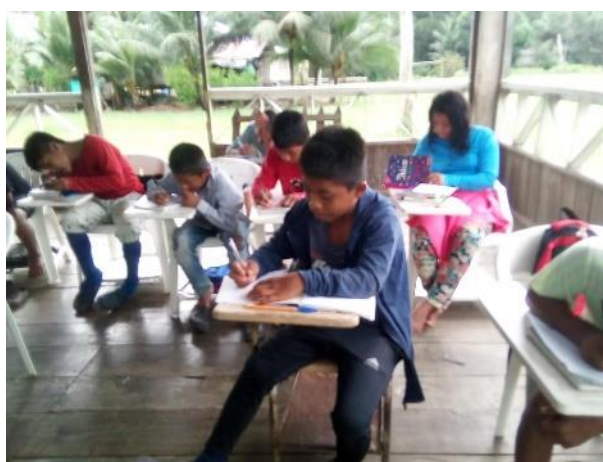
Ilustración 6 Estudiantes en la actividad de cuento ancestral