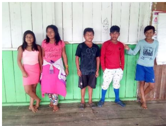
Ilustración 9 Niños y niñas socializando los cuentos