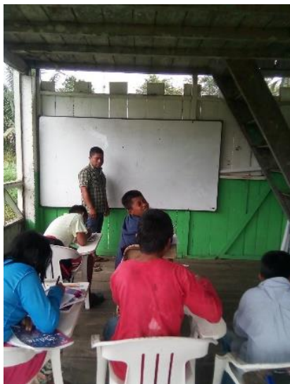
Ilustración 7 Socialización de cuentos ancestrales