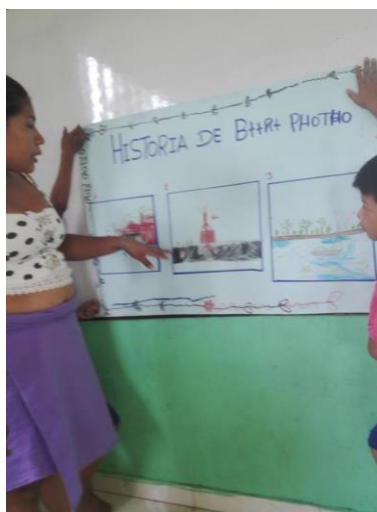
Ilustración 5 Cuento en láminas