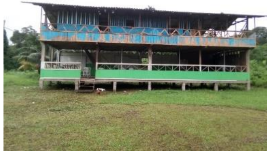
Ilustración 2 Centro Educativo La Tórtola

este centro educativo hay actualmente cinco grados, desde preescolar hasta quinto, con un total de cien estudiantes y cuatro docentes. En el grado tercero hay 22 estudiantes y es orientado por tres docentes indígenas.