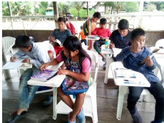
Ilustración 3 Niños y niñas del Centro Educativo Tórtola

La población con quién se trabajó este proyecto de grado es con los estudiantes del grado primero del centro educativo Tórtola, que en total son 20 estudiantes