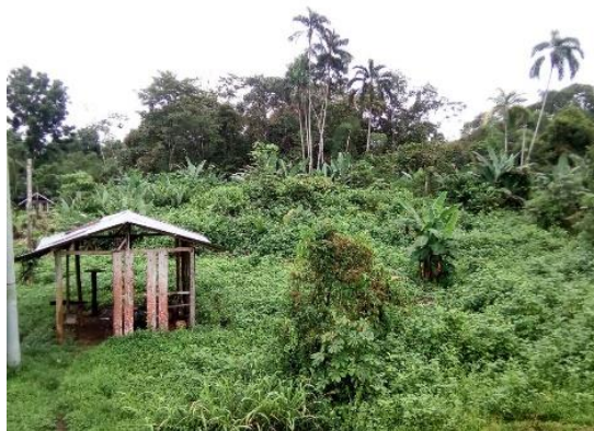
Ilustración 1 Sitio sagrado donde se reúnen los Mayores