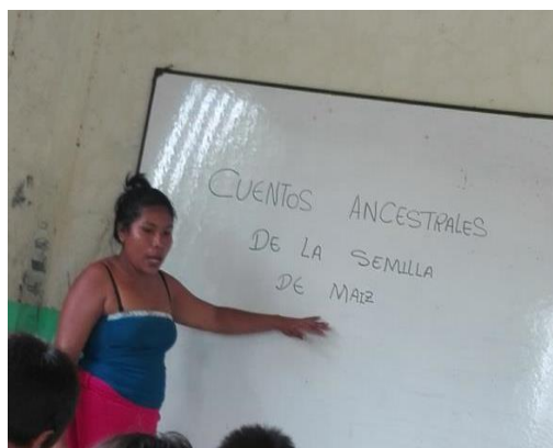
Ilustración 4 Clase de cuentos ancestrales