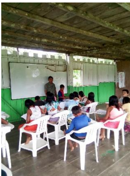
Ilustración 8 Actividad de cuentos ancestrales