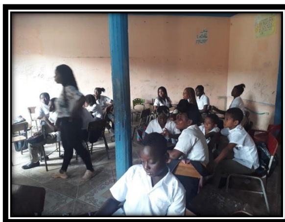
Ilustración 1 Estudiantes Afrodescendientes Comunidad San José del Tapaje

La etnoeducación es entendida para grupos étnicos que debe ser dada en valores teniendo en cuenta que nuestra identidad étnica es fundamentada en el mestizaje ya que provienen de diversas raíces como la africana, la indígena y la hispánica. Hay muchas comunidades educativas ubicadas en poblaciones mestizas que asumen el rol de ser etnoeducadores en su estrategia pedagógica, mientras que hay otras como las comunidades afrodescendientes e indígenas que son ajenas e indiferentes a la etnoeducación; hay muchos planteles educativos que aun manejan el discurso educativo que excluyen la diversidad cultural y la interculturalidad de los discursos de la colonia española.