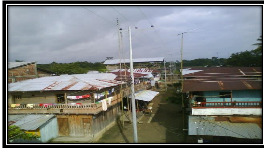
Figura 5. Vereda San José del Tapaje.