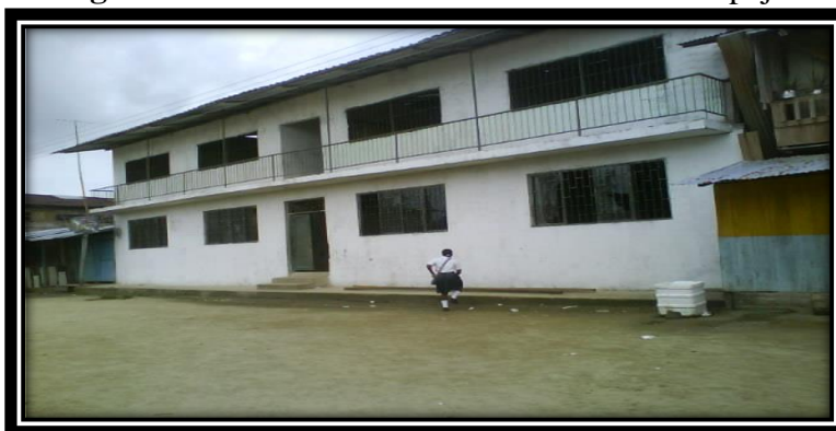
Figura 6. Institución Educativa San José del Tapaje.

La Institución cuenta con una buena cobertura en educación preescolar, básica primaria, básica secundaria y media vocacional. El establecimiento educativo de San José del Tapaje quedó organizada como una Institución Educativa así: Institución Educativa San José del Tapaje.