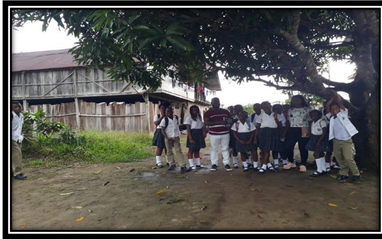
Figura 7. Estudiantes de grado 5° I. E. San José del Tapaje

cuenta con una fuente de trabajo estable, en su mayoría son agricultores y otra parte de la población se dedican a la minería artesanal; pero gozan de una gran riqueza en flora y fauna, amantes al deporte y sus principios religiosos son cristianos.