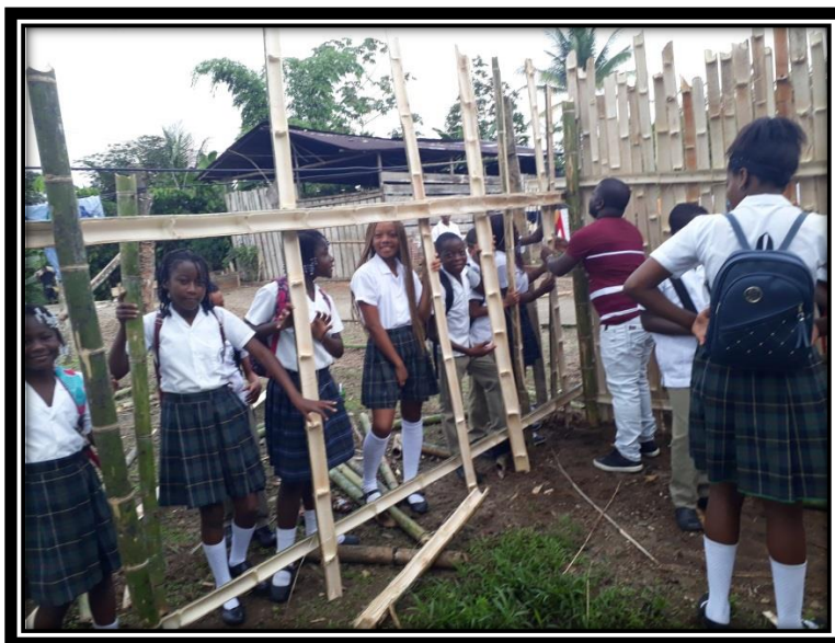
Figura 4. Construcción de la huerta

La huerta escolar, enseña a los niños a sembrar lo que ellos se comen y así mismo aprenden a cuidar y cultivar sus productos naturales y tradicionales para que no se pierdan, debemos tener en cuenta que por medio de la huerta también se les inculcan a los niños y niñas lo que son los valores y el cuidado del medio ambiente, y reconocer que nuestros productos tienen una mayor importancia que los productos de otros lugares.