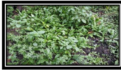
Figura 3. Planta de Albahaca (regional)

De igual manera Ramón Flórez (2015) da a entender que los remedios naturales y las plantas medicinales han sido hasta hace poco el único recurso curativo que el médico y el sabedor han tenido en sus manos.