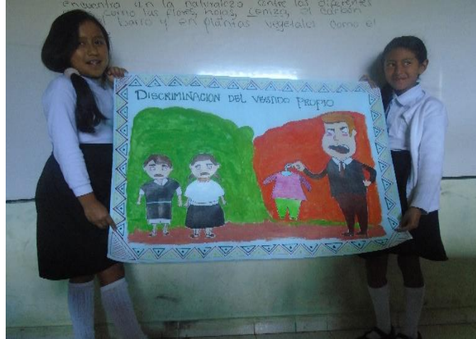
Figura 8. Resultado de identificación de la discriminación del vestido propio