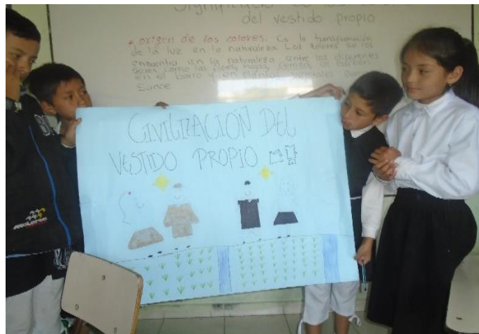
Figura 9. Resultado de identificación de la civilización del vestido propio