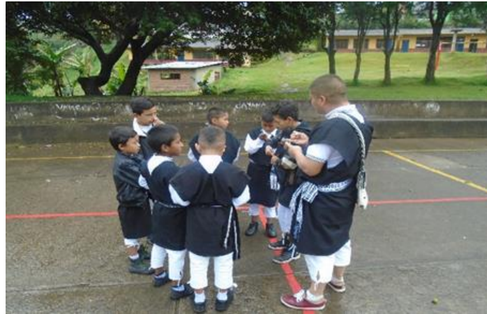
Figura 13. Minga de pensamiento del grupo de hombres

En la actividad realizada se puede analizar que cuando se hace la salida a la cancha del colegio y se realiza la actividad, de organizarse a través de la minga de pensamiento para hacer el cambalache, los estudiantes tienen otra actitud diferente, sus ánimos y energías aumentan, con lo cual en la realización de la actividad participan, se relacionan y se comunican más entre, Estudiantes y practicantes. Missiacos, S. (2011) afirma que utilizar otro medio “promueven relaciones más cercanas entre el alumnado y el profesorado. Estas relaciones se configuran tanto alrededor del contenido de trabajo como de aspectos personales” (p. 8), y esto pasa, cuando se realiza la minga de pensamiento, donde, en cada uno de los grupos de hombres y mujeres piden apoyo a los practicantes;