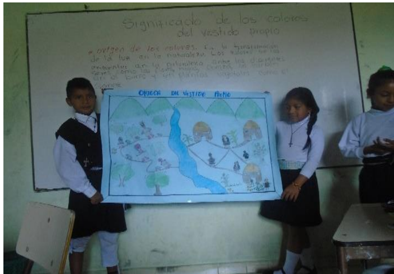
Figura 7. Resultado de identificación del origen del vestido propio

A hora bien, más adelante cuando se realiza la actividad a través de los recursos etnopedagógicos; de la minga de pensamiento y el cambalache se notó que los estudiantes interactúan más e identifican mejor las características más relevantes del tema de evolución del vestido propio desde el origen, discriminación y civilización, y esto se notó cuando los niños se relacionaban y tenían más confianza para participar en el intercambio de saberes y adquirirían otros conocimientos, que según (Paulo F, 2010, p. 9). “entre la interacción y dialogo las personas intercambian ideas, aprenden conjuntamente y producen conocimiento creando nuevos significados” por ello, fue muy necesario utilizar estos recursos propios de la comunidad Inga de Aponte porque ayudaron a reconocer las características del vestido, el cual se evidencio; cuando los estudiantes lograron identificar, describir y crear un dibujo con lo que le había dado a conocer la abuela sabedora.