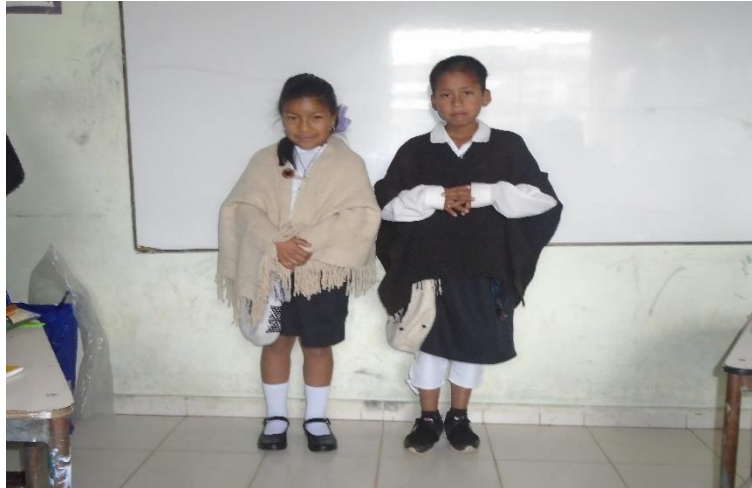
Figura 18. El buen uso del vestido propio

contexto cultural, generan un aprendizaje significativo, donde promovió a los estudiantes usar bien el vestido propio.