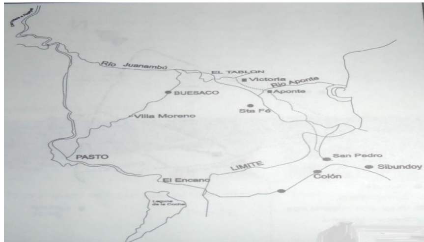
Figura 1. Localización de Aponte en el departamento de Nariño.

La siguiente propuesta denominada, comprendiendo y sintiendo usemos el vestido propio, se realizó en la república de Colombia, departamento de Nariño, municipio del Tablón de Gómez, Resguardo Inga en Aponte.