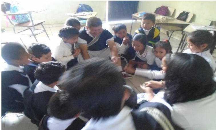
Figura 12. Interpretación y utilización de prendas para intercambiar saberes

Porque, los conectamos con la práctica que hacían antes los mayores y así mismo paso al interpretar el significado de los colores y las prendas del vestido propio.