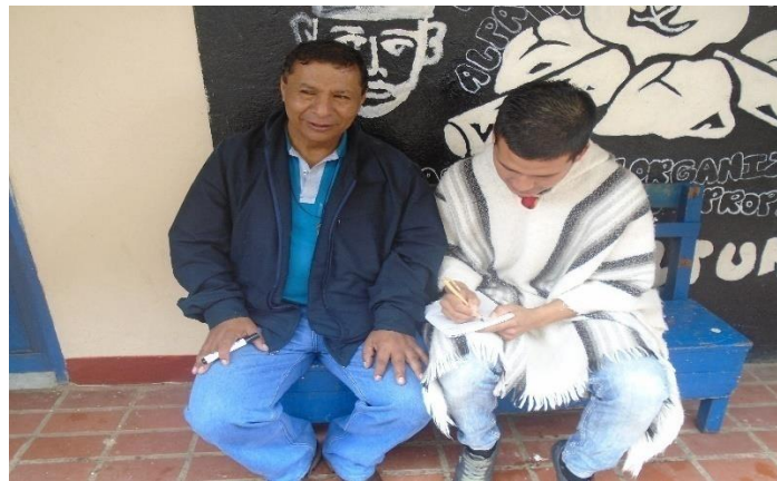
Figura 4. Entrevista de la causa principal del mal uso del vestido propio