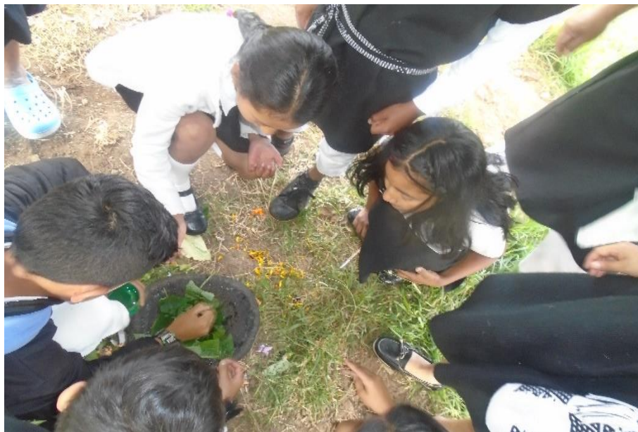
Figura 10. Participación del proceso de extracción de los colores del vestido propio

Por otra parte, en el ejercicio de extraer colores del vestido propio, los estudiantes hacían muchas preguntas del cómo hacerlo, el cual se notaba el interés por saber y practicar, luego cuando se empezó hacer el proceso de la extracción de los colores, participaban mucho, unos a otros se peleaban por practicar el ejercicio y se explicaban cómo hacerlo, según las instrucciones de la mayor.