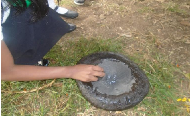
Figura 11. Material significativo propio de la cultura Inga de Aponte

Uchu rumi (piedra mediana) y guagua rumi (piedra pequeña), la piedra de sacar los colores, a Los estudiantes les llamo mucha la atención y observaron bien detalladamente la piedra, y no hallaban el momento de utilizarla. Por ello fue muy importante usar ese material propio significativo como la piedra;