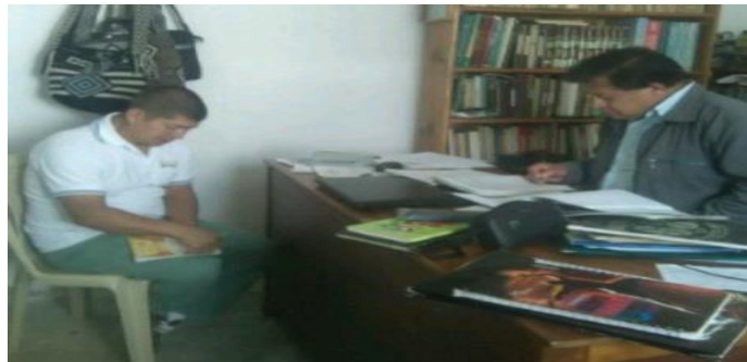
Figura 5. Entrevista del uso inadecuado del vestido propio.

Entonces, al identificar estas causas, se argumenta que adultos y jóvenes que se colocan inadecuadamente dando mala imagen a la cultura. Ejemplo, combinación de vestido propio con prendas occidentales, y los factores que influyen para que se de este fenómeno son: el modernismo, el capitalismo y los medios de comunicación masiva, causando desinterés y falta de pertinencia, estimulando así a que no le demos importancia y no reconozcamos que el vestido propio es un símbolo de nuestra identidad cultural. Afirmo, El antropólogo y profesor de la institución, Marco Tulio Carlosama: