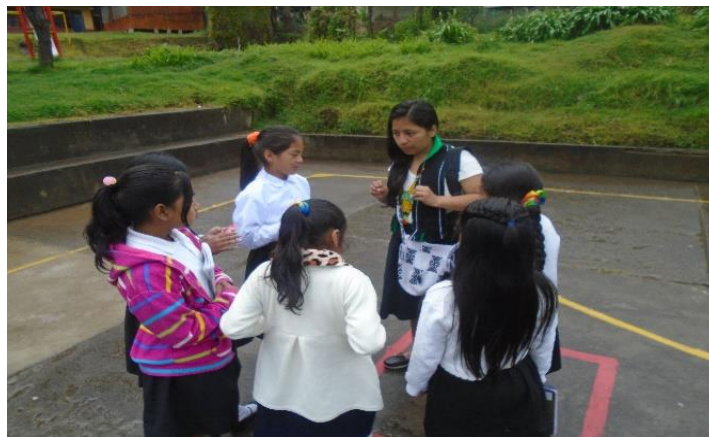
Figura 14. Minga de pensamiento de mujeres