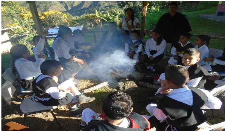
Figura 16. Lugar del quiosco con los mayores sabedores.

Por último, en el cuarto plan de aula de generar el buen uso del vestido propio en el Resguardo Inga en Aponte, en principio cuando se llega al lugar (el quiosco) donde se va hacer la actividad, de generar el buen uso del vestido propio, los estudiantes les llama mucho la atención, el espacio;