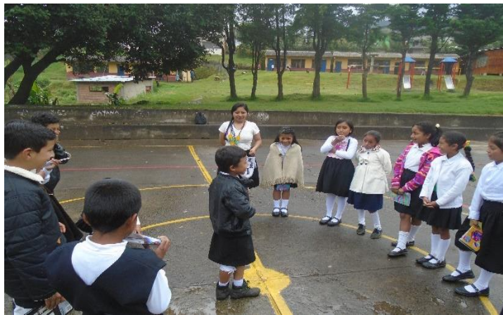
Figura 15. Intercambio de saberes de la importancia del significado del vestido propio.

Esto mostro interés por hacer bien el trabajo, porque cada grupo quería llegar a un acuerdo de crear un orden, de cómo quien iba hablar del color o prenda del vestido propio de primero, hasta el último del grupo, y se miraba que individualmente en el grupo cada uno quiere quedar bien, que como resultado, a los estudiantes, les intereso el tema, y eso se notó en el intercambio de saberes, cuando mostraban el esfuerzo de escuchar a los compañeros, lo cual les permitió a los 2 grupos estar muy atentos e identificar y participar con sentido a lo que el otro decía, que Según, (Julón, D; León, G; Vásquez, D. 2014) “Escuchar es deducir, comprender y dar sentido a lo que se oye” (p. 44), y esto paso cuando una niña dijo, mostrando la pacha, “hermanos ingas, la pacha significa protección del territorio” y u niño le dice “porque” y contesta otra niña, “porque nosotros tenemos un territorio y cuando salimos hacia fuera nos identificamos con el vestido propio y que si viene un señor blanco de afuera tiene que acatarse a nuestros usos y costumbres que nosotros tenemos”. De modo que, escuchar al otro, es la parte esencial de la comunicación oral de los estudiantes, con una capacidad compleja tempranamente desarrollada. Que según Freire (2006) “escuchar significa la disponibilidad permanente por parte del sujeto que escucha para la apertura del otro, al gesto del otro, a las diferencias del otro” (p.114)