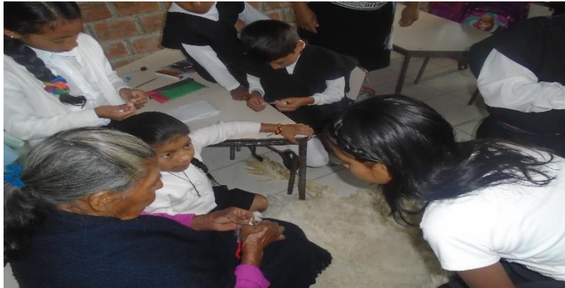
Figura 6. Estudiantes tizando la lana de ovejo del vestido propio.

Frente, al objetivo, Identificar la evolución del vestido propio desde el origen, discriminación y civilización en el Resguardo Inga en Aponte, se observó que los niños prestan atención más fácilmente, lo teórico, en forma de narración de un cuento y entretenidos haciendo manualidades en las manos, como en el ejemplo de tusar y tizar la lana de ovejo del vestido propio.