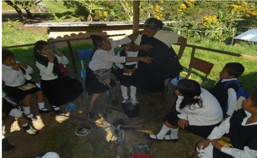
Figura 17. Enseñanza de las prendas propias del vestido propio

y, si se cuenta con la actitud apropiada, el aprendizaje será más fructífero” (p. 12). Así mismo pasa cuando los recursos etnopedagógicos son coherentes con lo que se va a hacer o hablar, produce el cambio a un nuevo aprendizaje. Que, según Freire, (2004) afirma que “es preciso aprender a ser coherente.