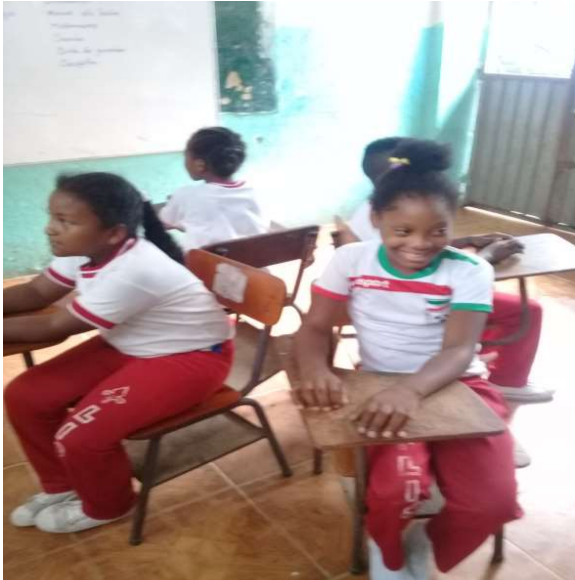
Estudiantes participando en actividad dinámica