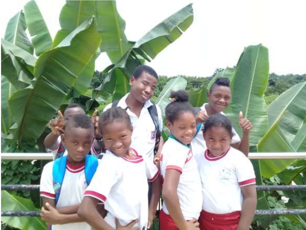
Salida de campo con las y los estudiantes