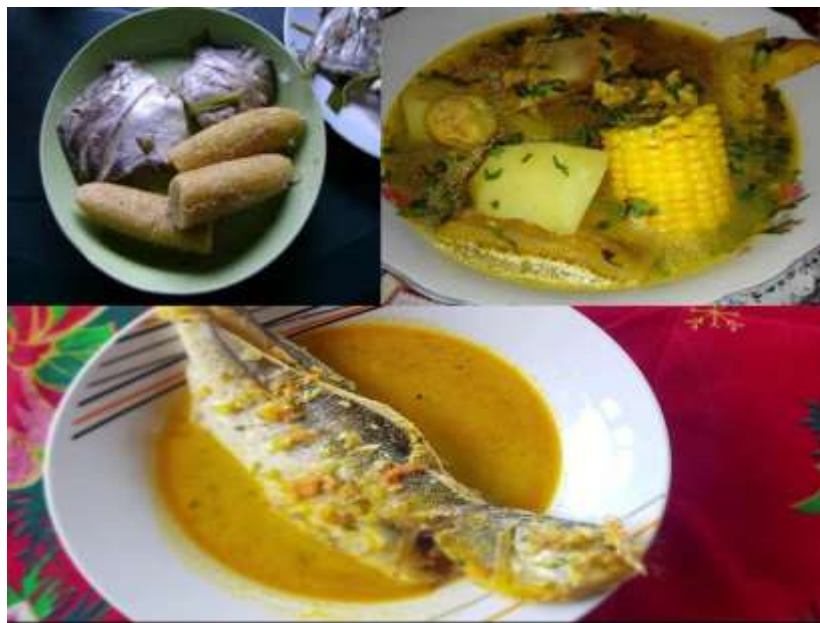
Figura: 1 platos típicos