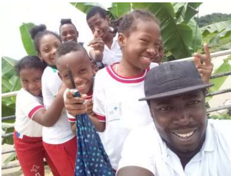
Figura 4. Salida de campo