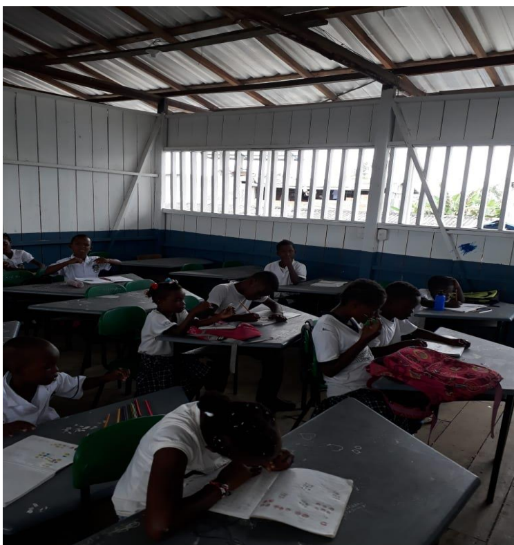
Figura1: Estudiantes del Centro Educativo Codemaco