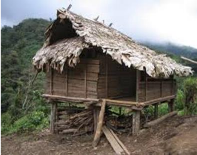
Figura 4. La Maikin Yal, la Casa Antigua Awá