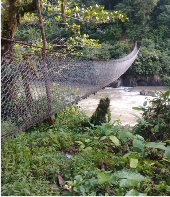
Figura 2. Territorio Awá.