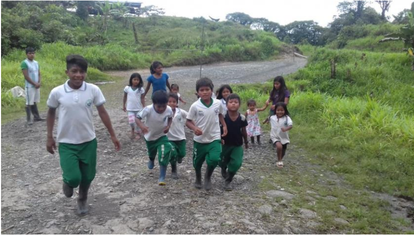
Figura 8. Reconoce las características propias de los mitos y las leyendas.