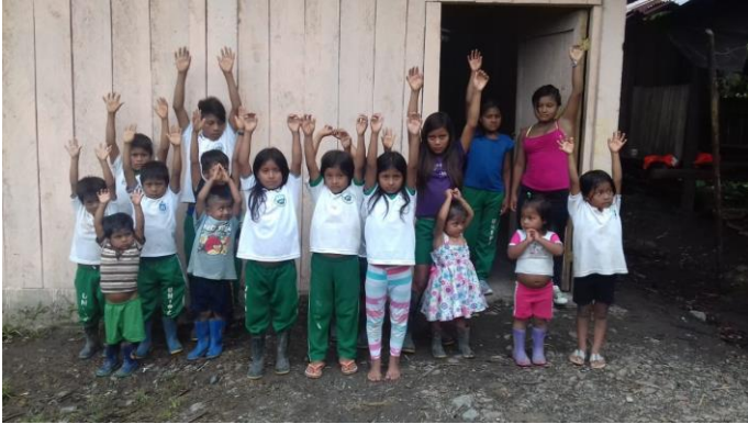
Figura 6. Reconoce las clases de sustantivos, el género y el número del sustantivo.

Se realiza un taller donde los estudiantes puedan identificar características de género narrativo, y se solicita realizar una pequeña dramatización con referencia a la historia escuchada.