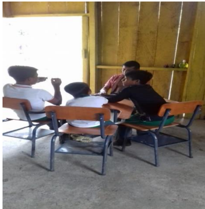
Figura 5. Reconoce textos en los tres géneros literarios.

Se realiza un encuentro con uno de los mayores de la comunidad Awá, se solicita narre historias de la Maikin Yal, la Casa Antigua.