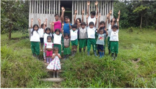
Figura 9. Niños con alegría dan cuenta de su creatividad narrativa