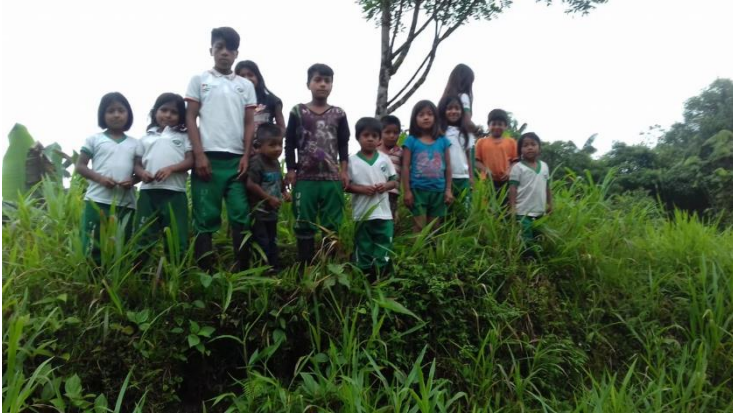
Figura 7. Leyendo desde el territorio