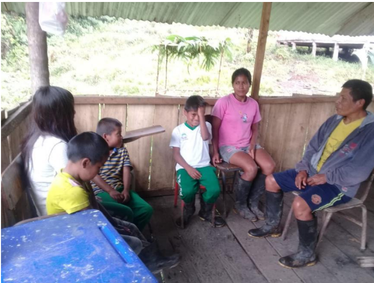
Figura 3. Narraciones con los mayores del pueblo Awá

Esta propuesta etnoeducativa se presenta como una herramienta pedagógica para mejorar los procesos lectoescritores para los estudiantes del grado cuarto del Centro Educativo Anzama Pí, de la Comunidad Awá en el municipio de Barbacoas Nariño.