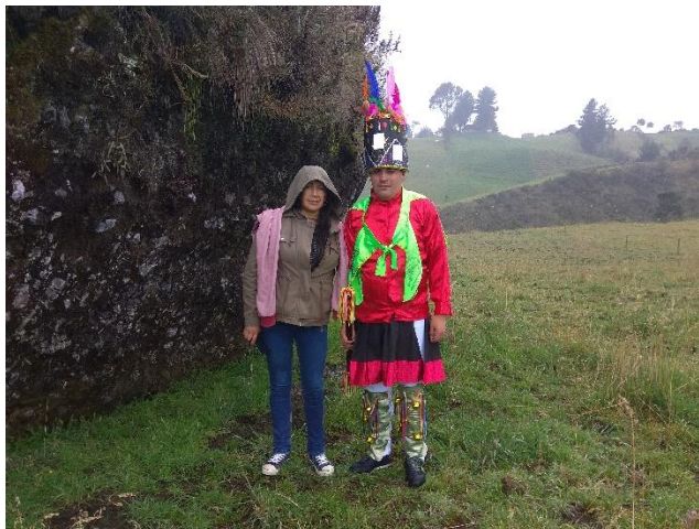
Figura 8. Visita Piedra de la Wuakamulla por Grupo de Investigadores