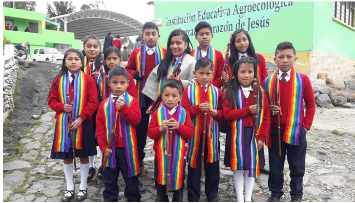
Figura 1. Cabildo Estudiantil en la Institución Educativa

Los saberes propios de los Cumbales son considerados como el conjunto de conocimientos, usos, costumbres y representaciones culturales, que como lo comparten los demás estudiantes participantes del proceso, son transmitidos de generación en generación y albergan la sabiduría y experiencia acumulada por una cultura a través de los años, siendo los mayores de la comunidad los principales encargados de esta transmisión mediante la tradición oral, dichos saberes son percibidos por la comunidad como un elemento fundamental de su identidad, ya que están vinculados a sus mitos de origen, su cosmovisión, sus formas particulares de producción, medicina tradicional, ley de origen, etc. Así mismo, se reconocen los saberes como una propiedad colectiva que los diferencia de otros pueblos, al otorgarles características diferenciales a nivel productivo, de organización social y espiritual, etc. Estos saberes se aplican en la vida cotidiana de sus miembros como resultado de la experiencia, lo que da cuenta de la dimensión dinámica de los mismos, porque enlazan el pasado con el presente, siendo la base de la proyección futura de una comunidad. Se trata de saberes en constante transformación.