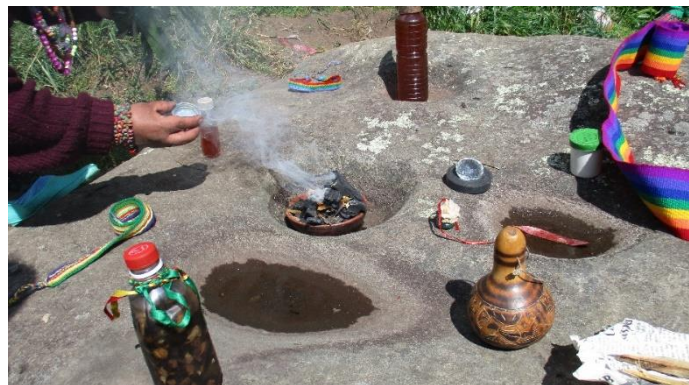
Figura 10. Ritual Piedra de siete alqueros

A través de este espacio identificamos el verdadero sentir de nuestra identidad cultural ya que al realizar estas actividades se observa durante los rituales respeto, compromiso y entrega total con esta actividad, en la música la composición de sus letras y sus acordes llamativos, ritmos propios de nuestra cultura y por otra parte la danza en la cual a través de sus movimientos y expresión corporal nos dan a conocer la lucha y el esfuerzo de salir adelante y con la frente en alto después de un largo proceso de trabajo.