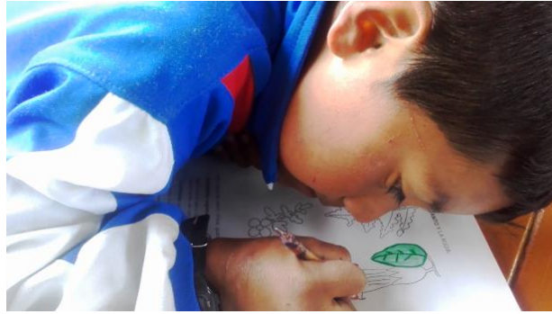
Figura 4. Dibujo Pintura cartilla Fuente: Hugo Daniel Taramuel