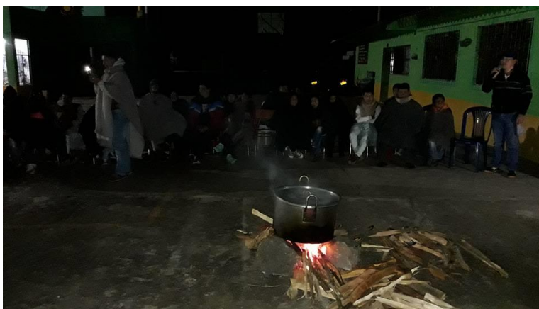
Figura 9. Olla Comunitaria conversatorio I.E. Sagrado corazón de Jesús

Esta actividad resulta supremamente importante porque alrededor del fogón se revitaliza la palabra, al atizar el fogón recordamos a nuestros mayores, al recibir el calor de sus llamas se despierta el sentido de pertenencia hacia nuestra cultura y la naturaleza, por otra parte el compartir nuestra soberanía alimentaria nos hace recordar el trabajo y el esfuerzo de nuestra gente que con sacrificio dedicación nos brindan los frutos que produce nuestra madre tierra lo cual nos permite vivir y pervivir en el existir.