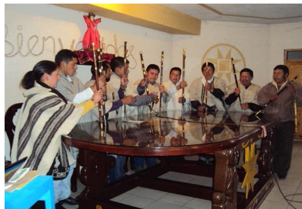
Figura 5. Apertura de sesión Minga de Pensamiento Cabildo del gran cumbal

En esta actividad participaron estudiantes, docentes, padres de familia, taitas, sabedores y médicos tradicionales en este espacio seleccionamos diferentes temas de trabajo como la shagra, la minga, el truke, las fiestas, cuentos mitos y leyendas puesto que es una actividad importante dentro del intercambio de conocimientos y saberes de nuestra cultura, para este caso los invitados realizan aportes de sus experiencias propias y vividas por nuestros antepasados para fortalecer nuestros saberes, de esta manera vamos recabando y recopilando información que nos ira fundamentando nuestro trabajo investigativo.