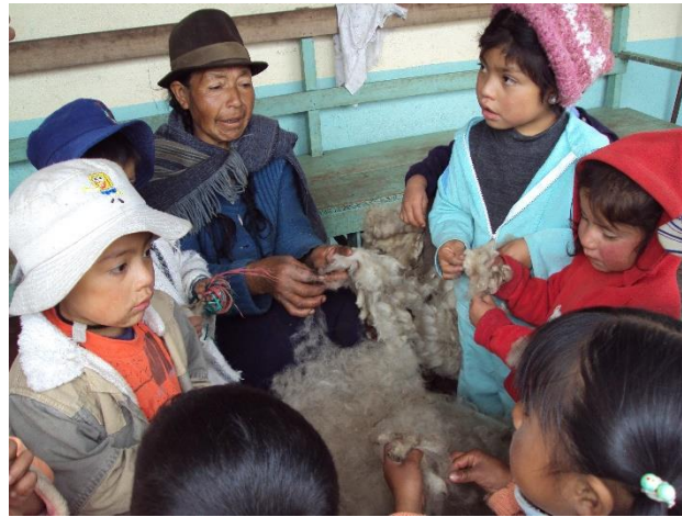
Figura 2. Tizando lana y compartiendo la palabra

identidad, pues hay muchas formas, o sea los escenarios que hoy estamos hablando, yo recuerdo que antes en el fogón era donde se planeaba todo con la mujer, los hijos y que bueno fuera que estos espacios se los pudiera recuperar, pero esto tal vez ya ni en la casa lo tenemos.