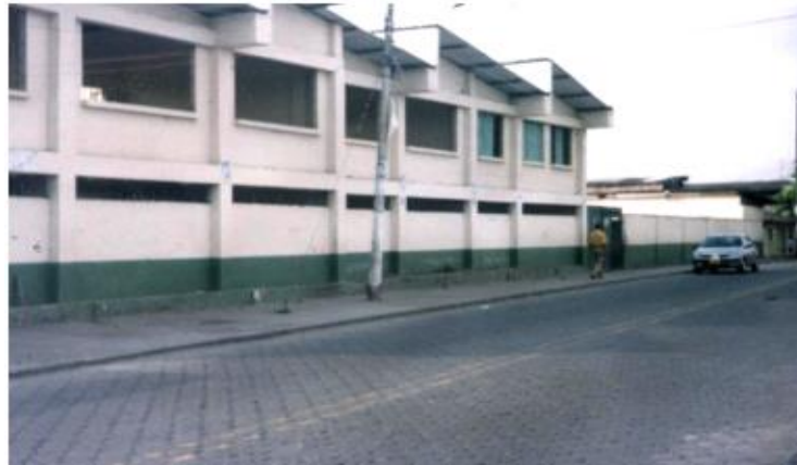
Figura 2. Institución Educativa R. M. Bischoff, sede principal

2.3.2 Microcontexto: la Institución Educativa Robert Mario Bischoff. La Institución Educativa Robert Mario Bischoff, pertenece a la comuna No. 4, se encuentra ubicada en la Avenida La Playa, Barrio la Paz, la cual limita así: Al Norte con el Barrio Tres Cruces; Al Sur con el Barrio Viento Libre; Al Oriente la Avenida la Playa y Avenida Férrea; Al Occidente con el Barrio La Paz zona de bajo mar. (Ver figura 2).