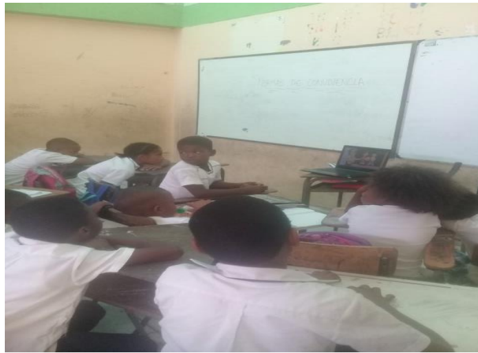
Figura 1. Estudiantes de la institución Educativa R. M. Bischoff