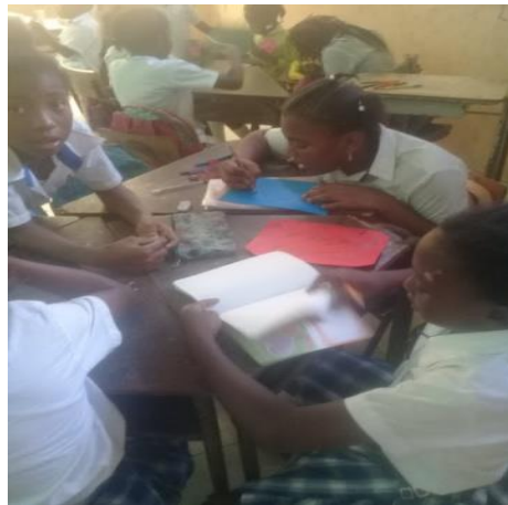
Figura 5. Pactos de aula