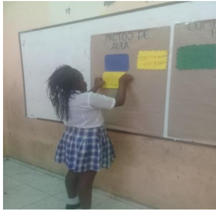
Figura 3: Actividad 3 comportamientos buenos y malos