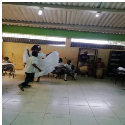
Figura 5: Enseñanza de la danza del currulao