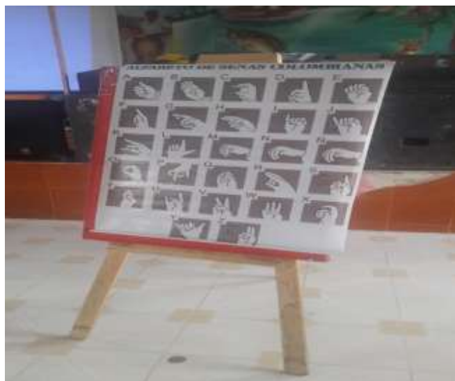
Figura: 15 comunicaciones por medio de señas

El proceso metodológico en la enseñanza de las manifestaciones artísticas regionales y locales, iniciamos con una serie de cantos regionales, los cuales fueron armonizados con marimba y otros instrumentos propios de la región en donde los niños participaron armónicamente, bailando y cantando. Después realizamos un comentario de lo ocurrido cada uno dio su opinión personal acertando sobre el tema tratado.