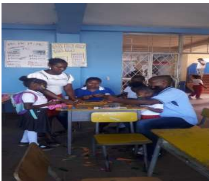
Figura 17. Realizando Avisos publicitarios