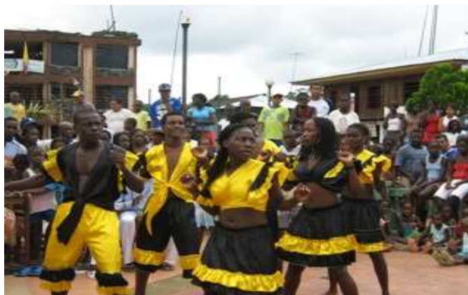
Figura 16. Baile de marimba

En la comprensión de textos, se realizaron lecturas de agrado para el niño o niña, donde ellos con ayuda de imágenes lograban explicar el contenido de ellas, a nivel individual y grupal. Aquí elaboraron de forma grupal carteleras de carácter informativo.